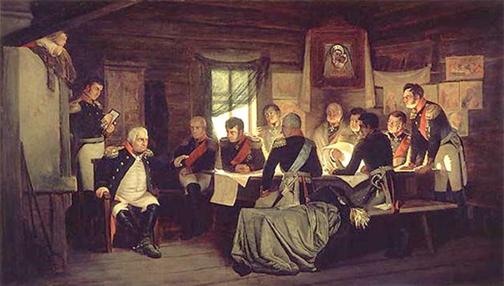
«Военный совет в Филях» работы художника А. Д. Кившенко. 1880