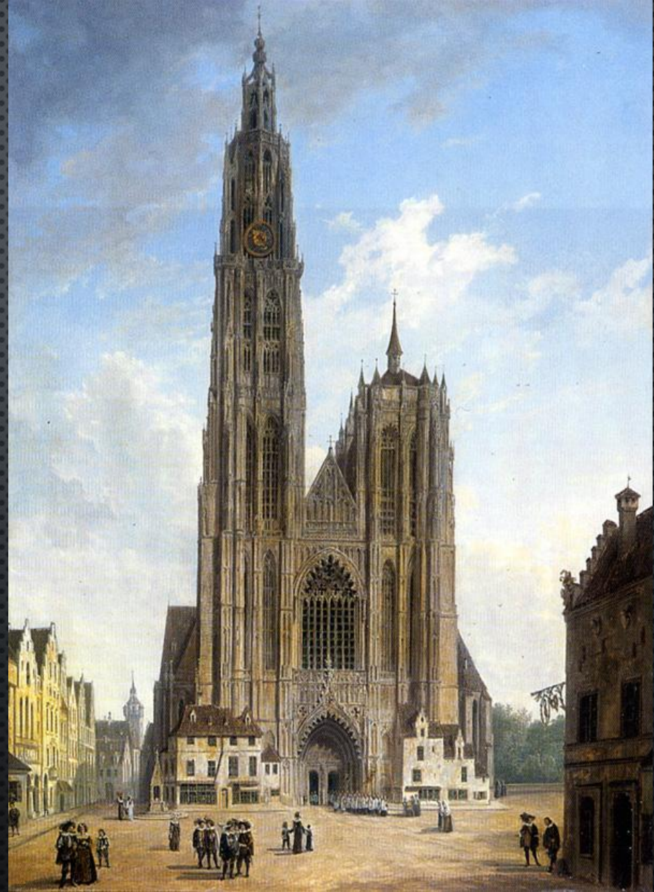
СОБОР АНТВЕРПЕНСКОЙ БОГОМАТЕРИ (БЕЛЬГИЯ)