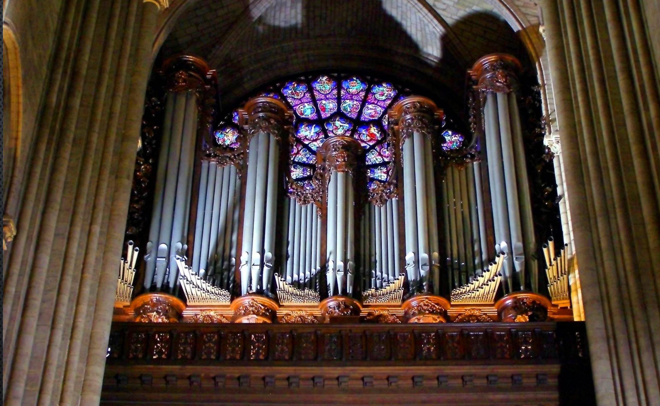
Орган в соборе Парижской Богоматери