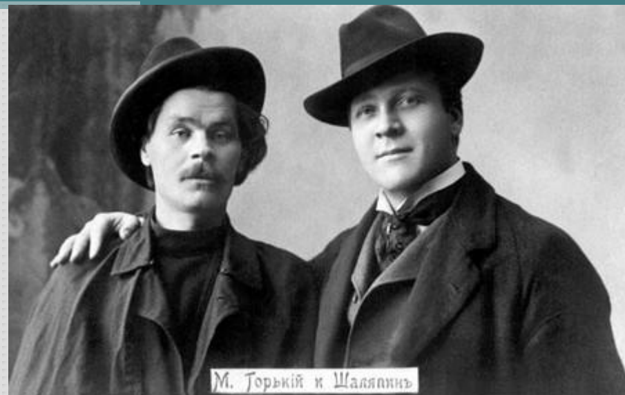
Певец Федор Шаляпин с другом писателем Максимом Горьким

Родители Федора Шаляпина обвенчались в январе 1863 года, а через 10 лет у них родился сын Федор. Отец работал архивариусом в земской управе. Мать Федора – Евдокия Михайловна была обычной крестьянкой из села Дудинцы.