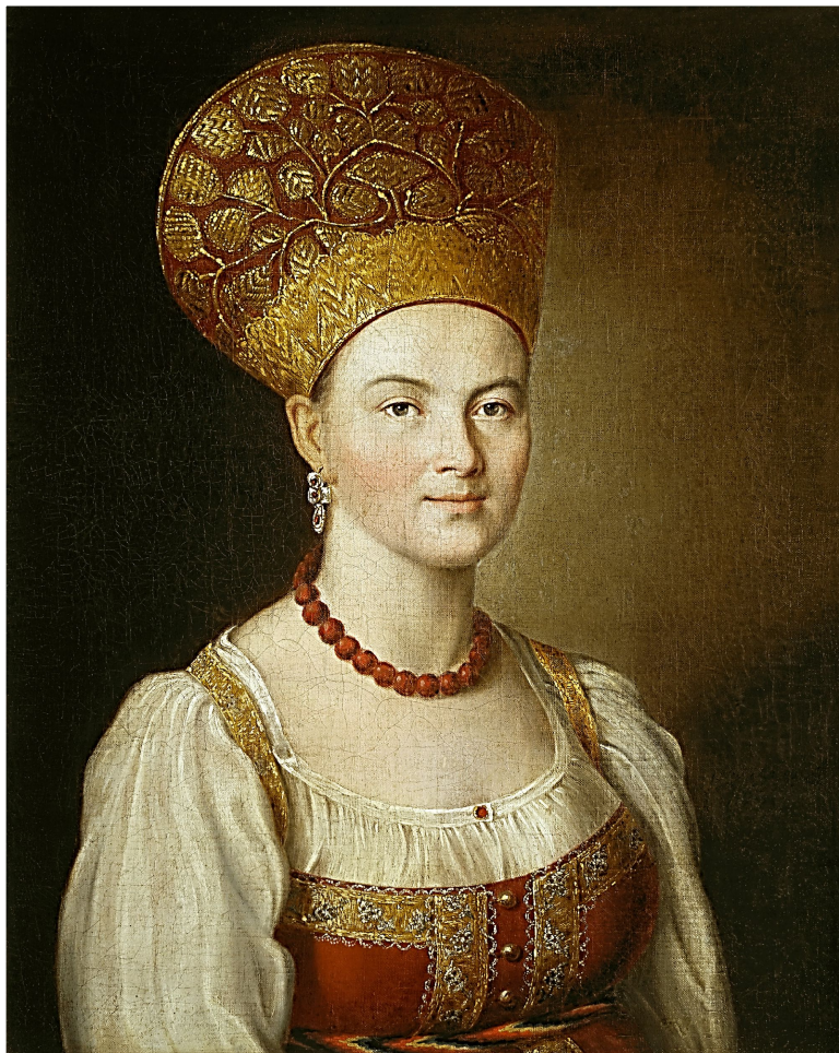
И.П. Аргунов. Портрет неизвестной в русском костюме