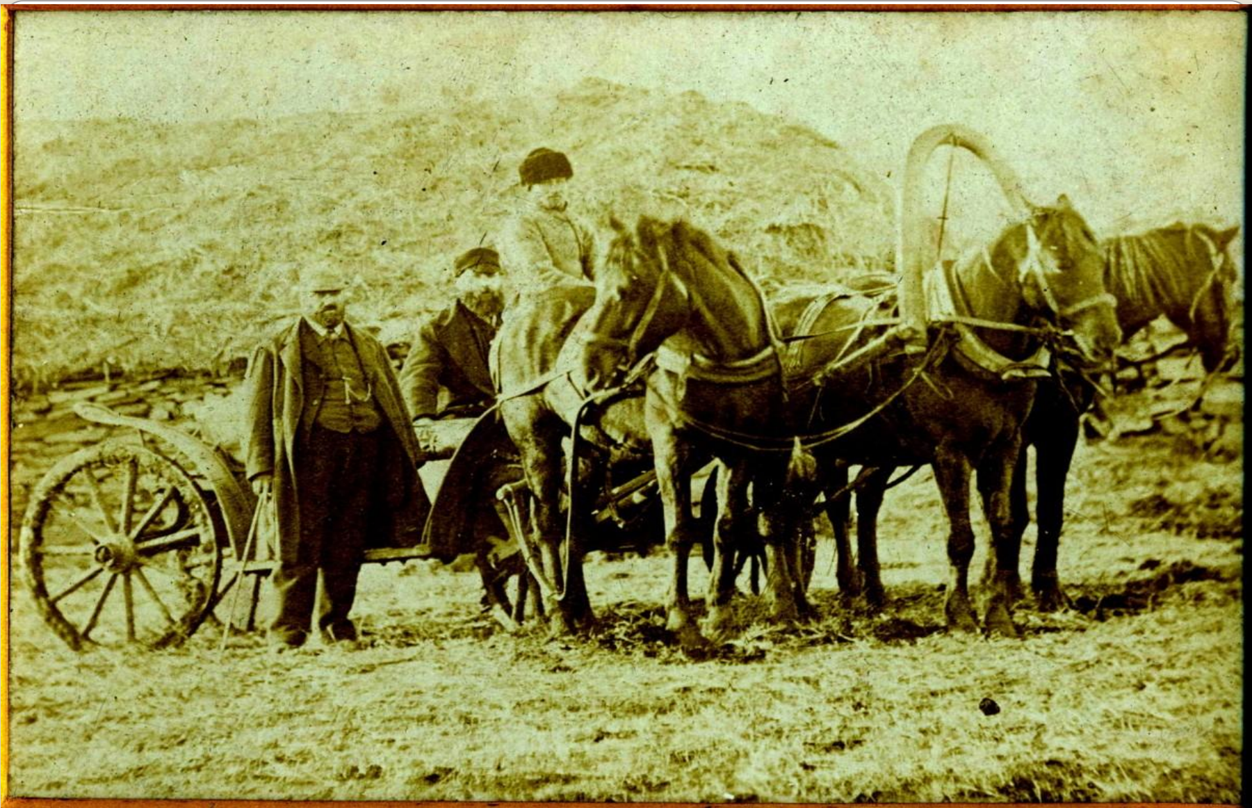
Н.А. Некрасов «ТРОЙКА»