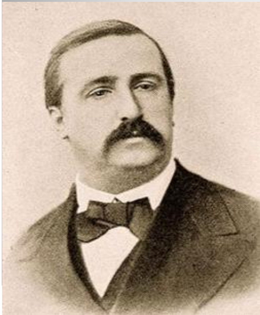
М. П. Мусоргский