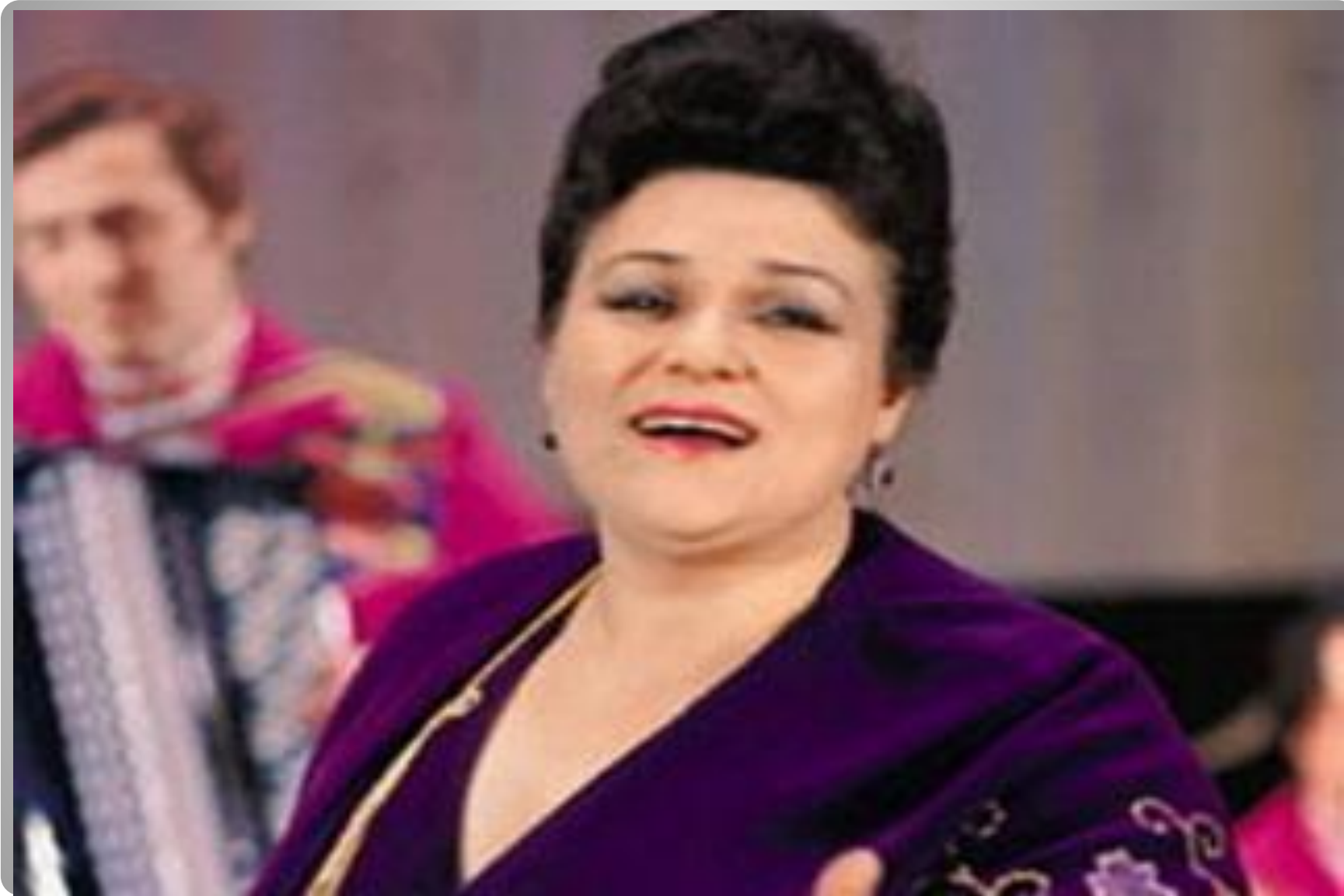
Людмила Георгиевна Зыкина