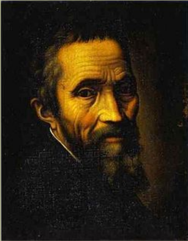
Микеланджело Буонарроти Michelangelo Buonarroti 1475 — 1564