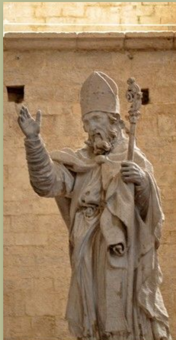
Якопоне да Тоди 1230–1306

Как горевала и печалилась, И трепетала, видя Рожденного ею, Пребывающего в страшных муках.