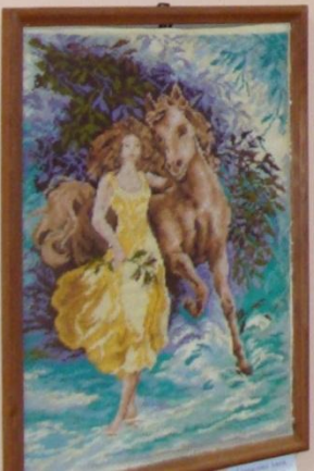
Васильев П.П. Женщина и лошадь 2023 г.