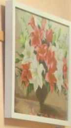
Новиков Е.Е. Цветы 2023 г.