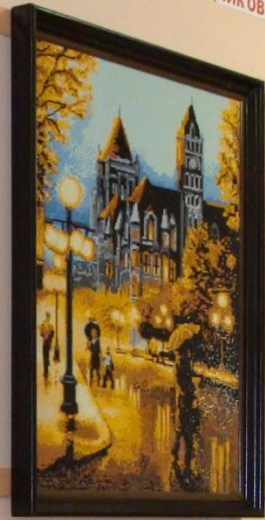
Сидоров А.А. Ночной город 2023 г.