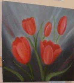
Козлов В.В. Тюльпаны 2023 г.