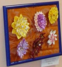
Смирнов А.А. Цветочный букет 2023 г.