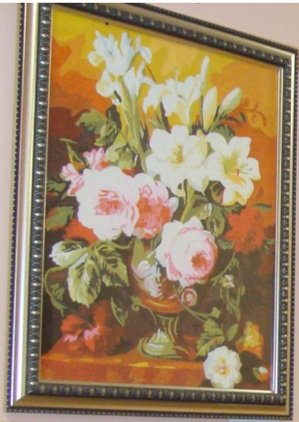
Иванов И.И. Букет цветов 2023 г.