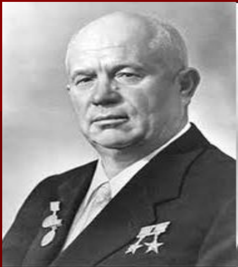
Н. С. Хрущев

С 1955 г. гимн СССР всегда и всюду исполнялся без слов.