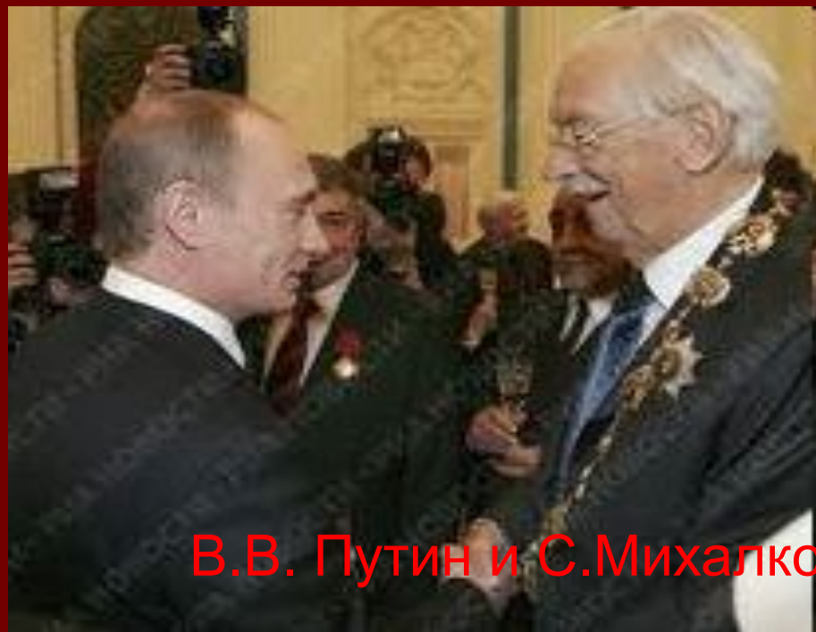
В.В. Путин и С.Михалков

Главное - чтобы гимн мог спеть любой живущий в нашей стране человек.