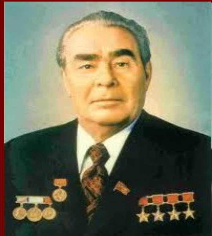
Л. И. Брежнев

С 1955 г. гимн СССР всегда и всюду исполнялся без слов.