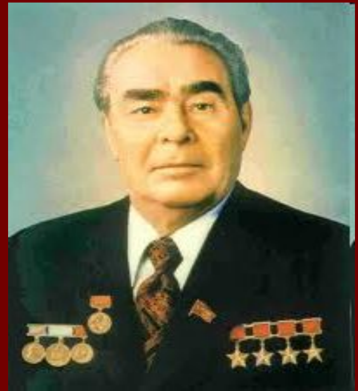
Л. И. Брежнев

С 1955 г. гимн СССР всегда и всюду исполнялся без слов.