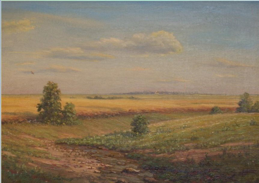
А. Борисов. Высохший ручей