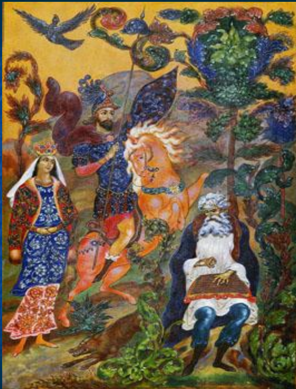
Иллюстрация к книге «Слово о полку Игореве»