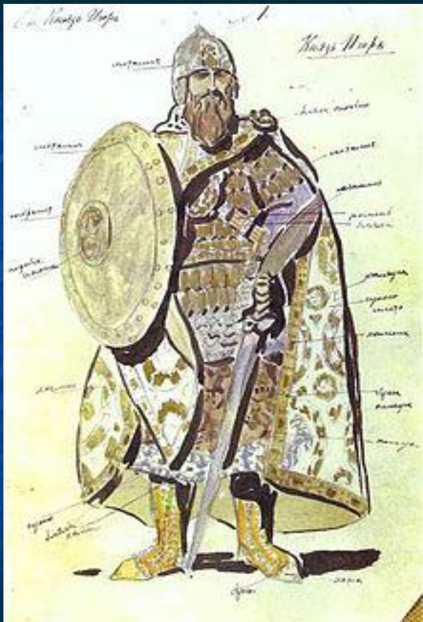
Эскиз костюма князя Игоря