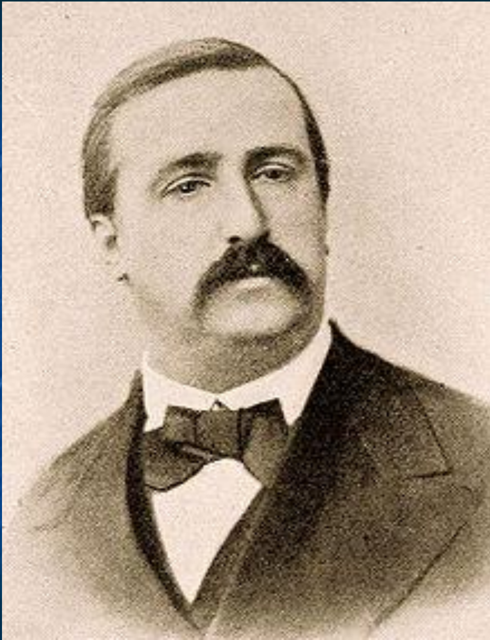
Александр Порфирьевич Бородин (1833-1887)