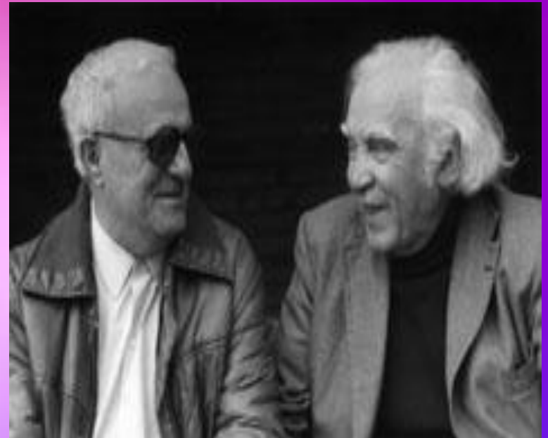
Г.Свиридов с грузинским композитором О. Тактакишвили и эстонским дирижером Г. Эрнесакс.