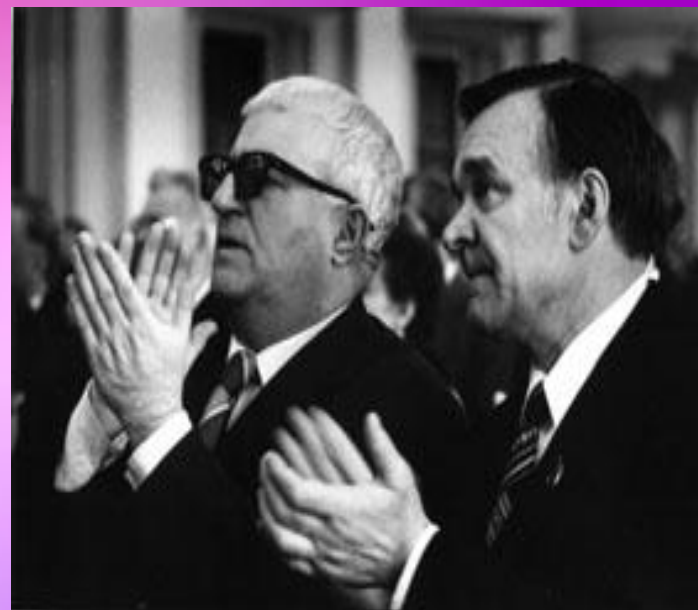
Г. Свиридов с писателями В. Распутиным и Ю.Бондаревым