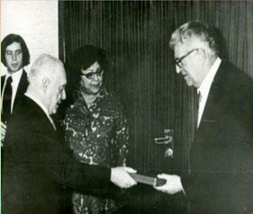
Вручение Георгию Свиридову французских наград, Париж, 1969 г.