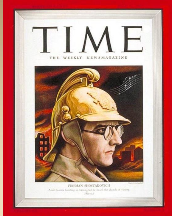
Дмитрий Шостакович на обложке журнала Time