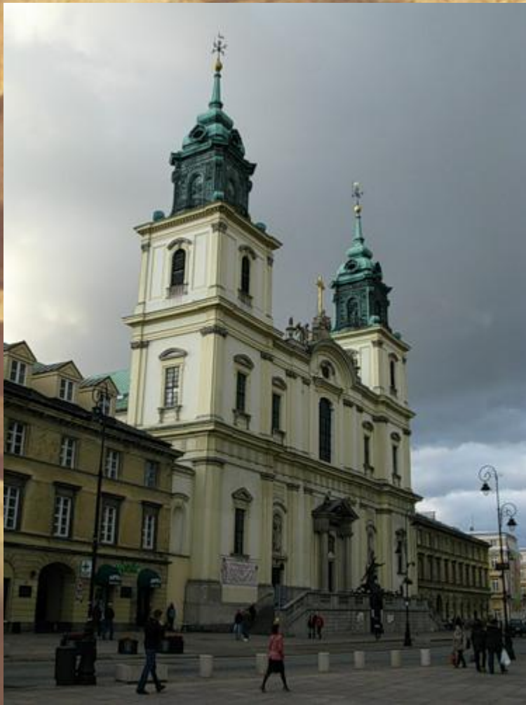
Костел Святого Креста в Варшаве