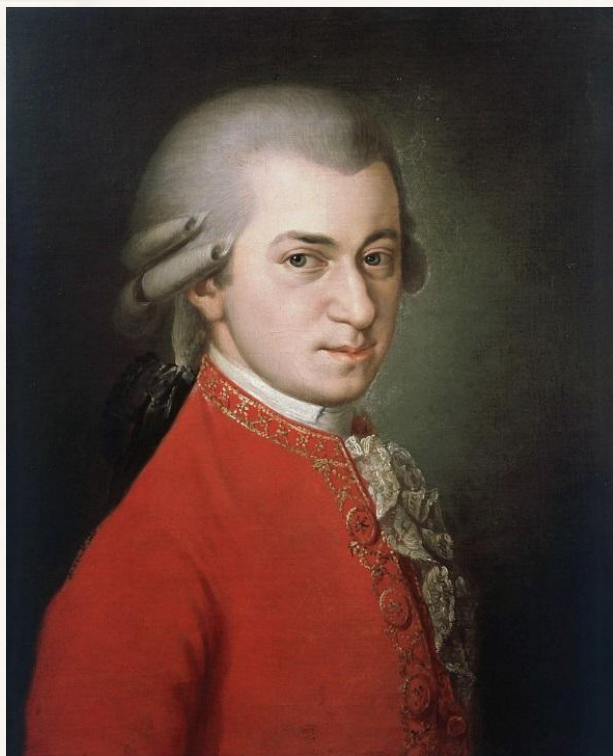
Кристоф Виллибальд Глюк