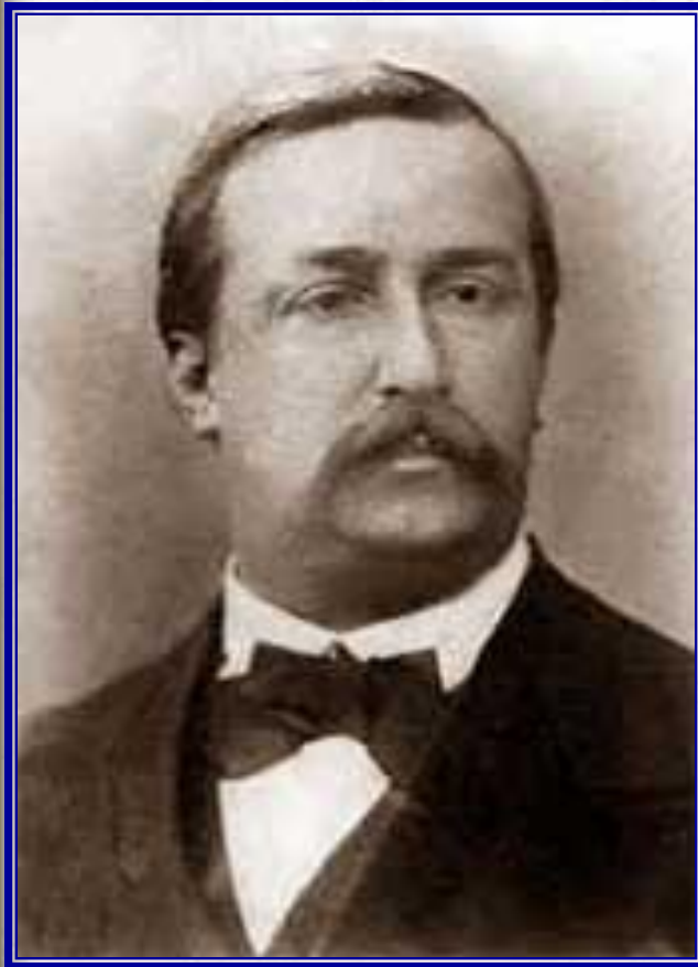
А. П. Бородин