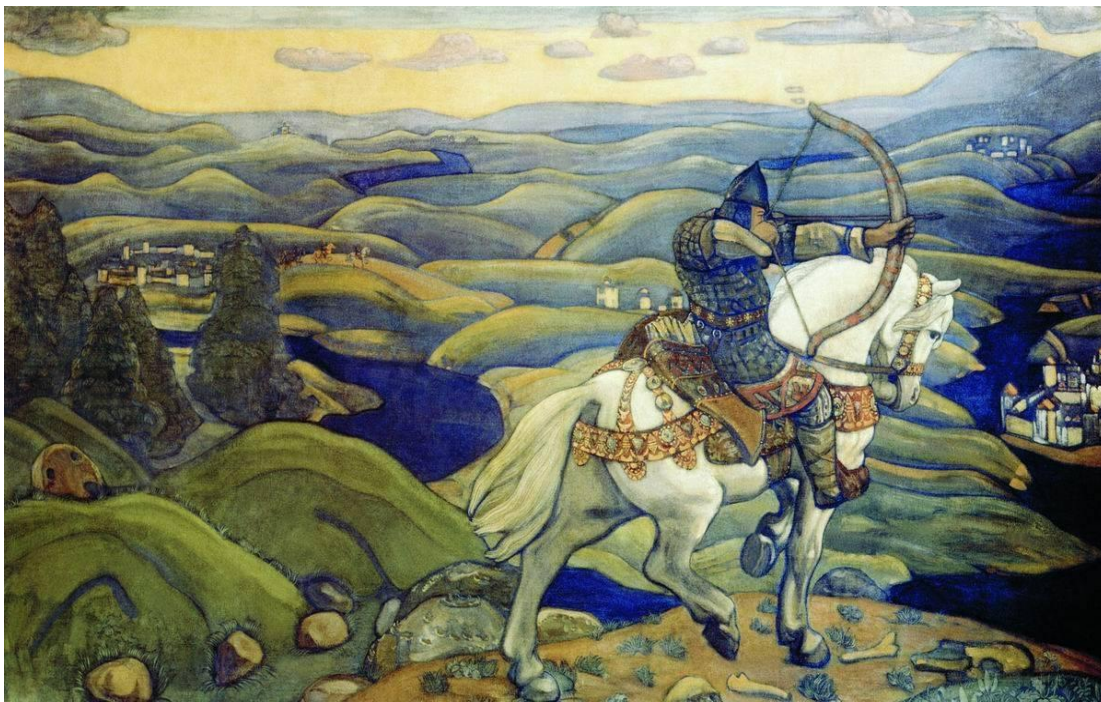
Картина "Илья Муромец" Николая Рериха