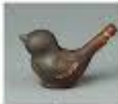
Саистулык (из глины или дерева).