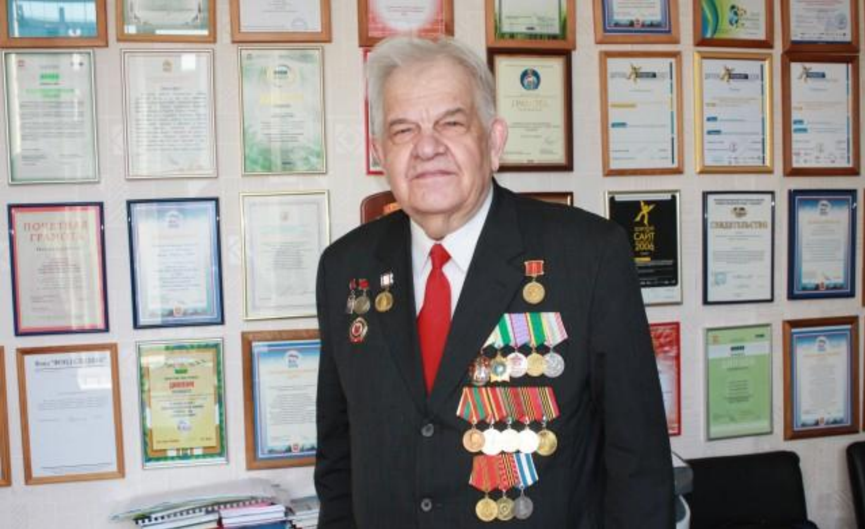
«Орленок» Олега Кульдяева, слова : Ефима Ховив