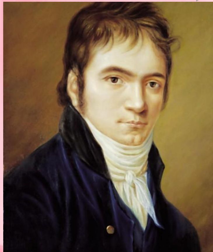
Людвиг Ван Бетховен