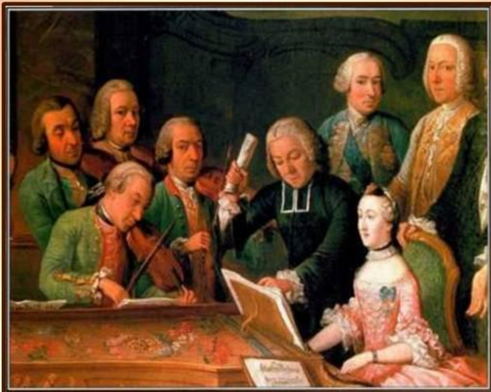
фрагмент картины Поля Жозефа Дельклоша «Концерт в Льеже»

Шестеро его детей стали знаменитыми музыкантами, даже сумевшими на время затмить славу отца.