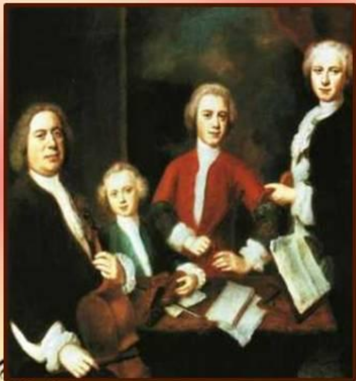
Б. Деннер. Иоганн Себастьян Бах с сыновьями