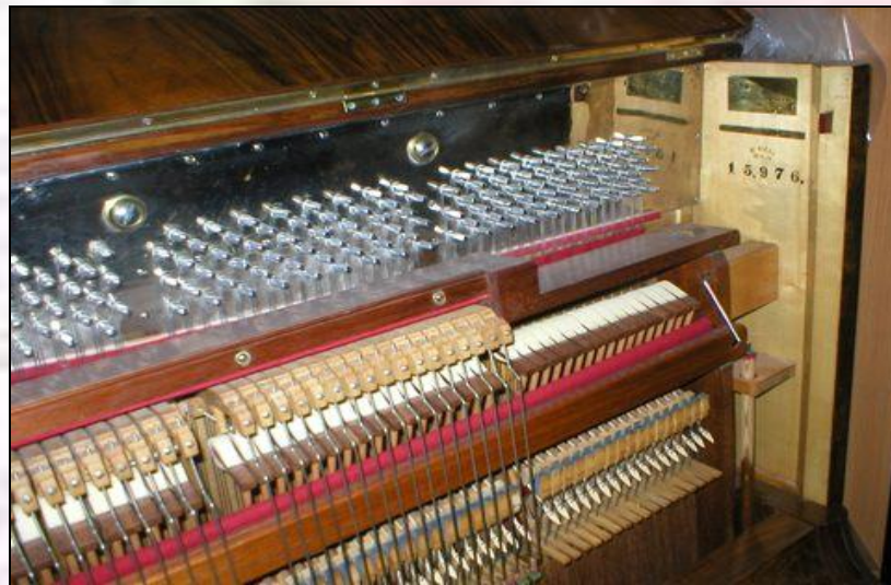
Рама Струны Молоточк и Колки