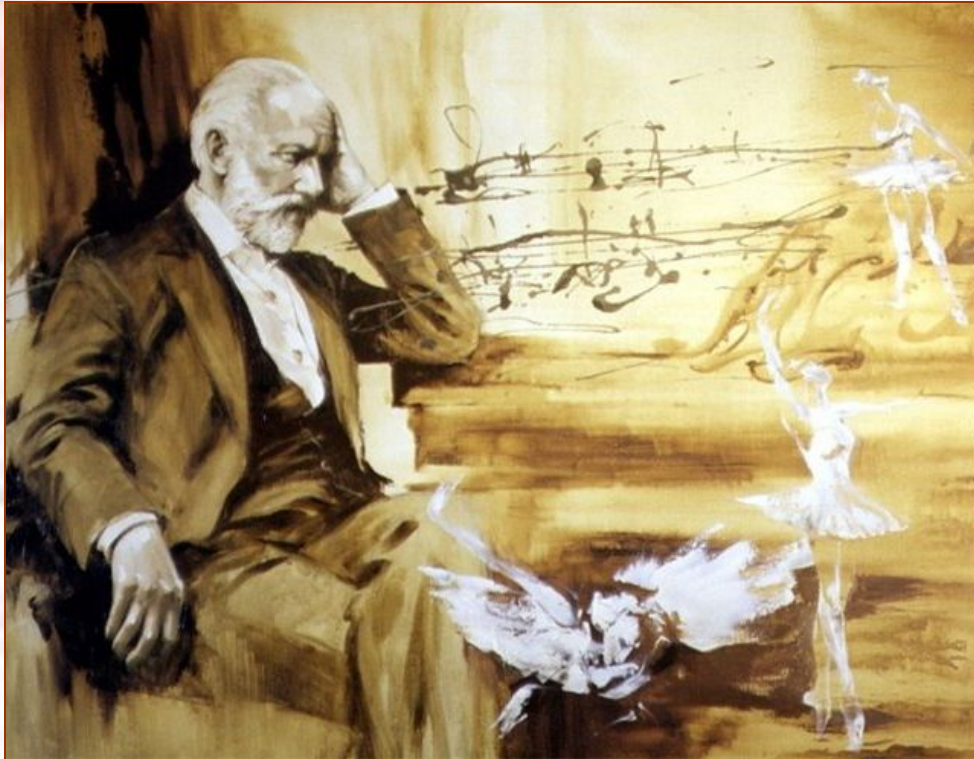
Пётр Ильич Чайковский «Детский альбом»