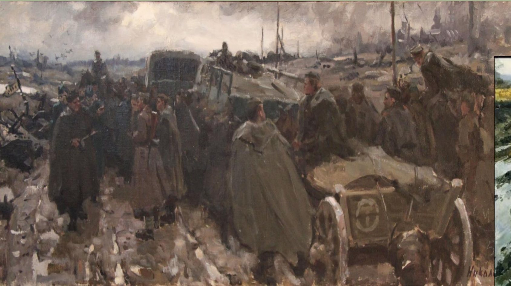
Б.П.Николаев. Дороги войны. 1956 г.