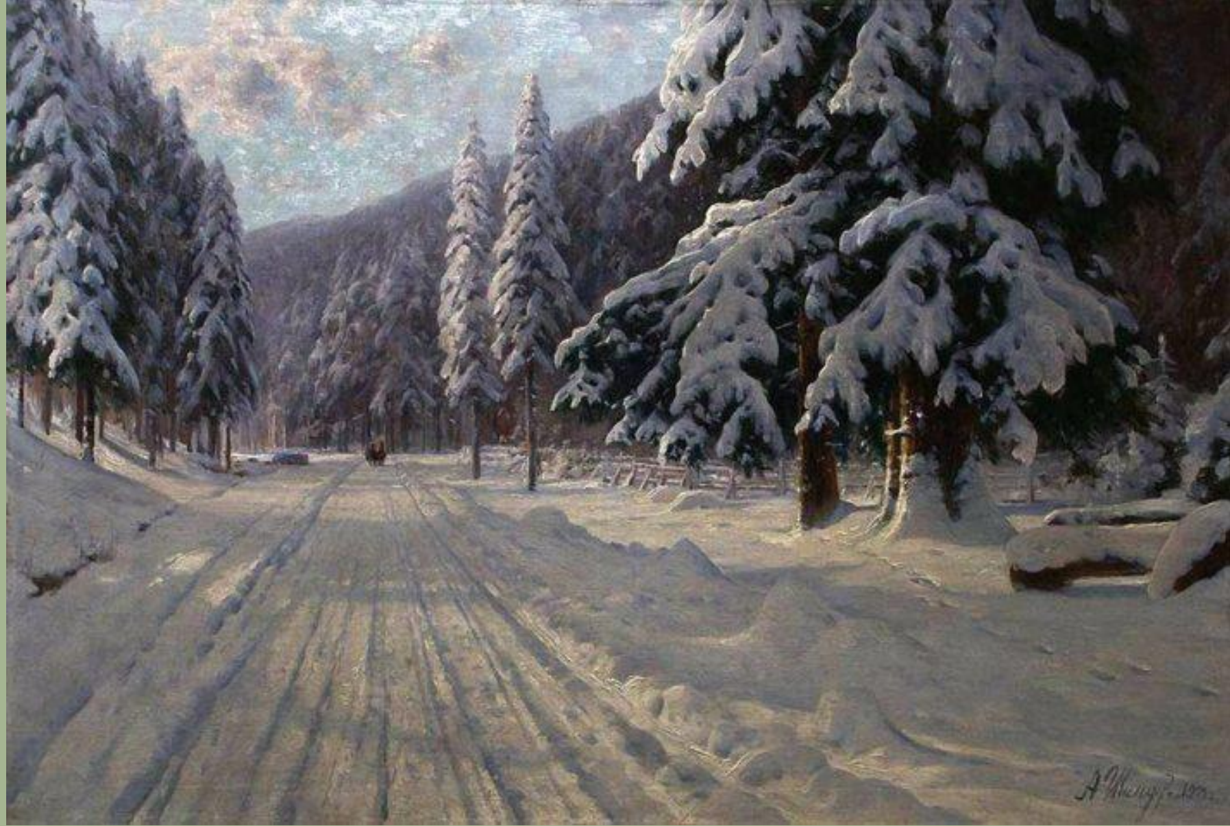
Андрей Николаевич Шильдер. Зимняя дорога (1904 г.)