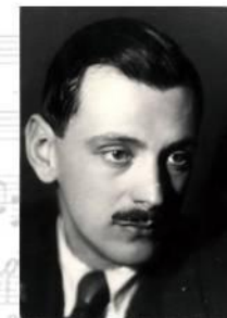
С. В. Михалков

Официально используется с 15 марта 1944.