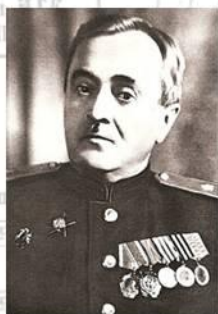
В. И. Лебедев-Кумач

Государственный гимн Советского Союза (1943-1955).