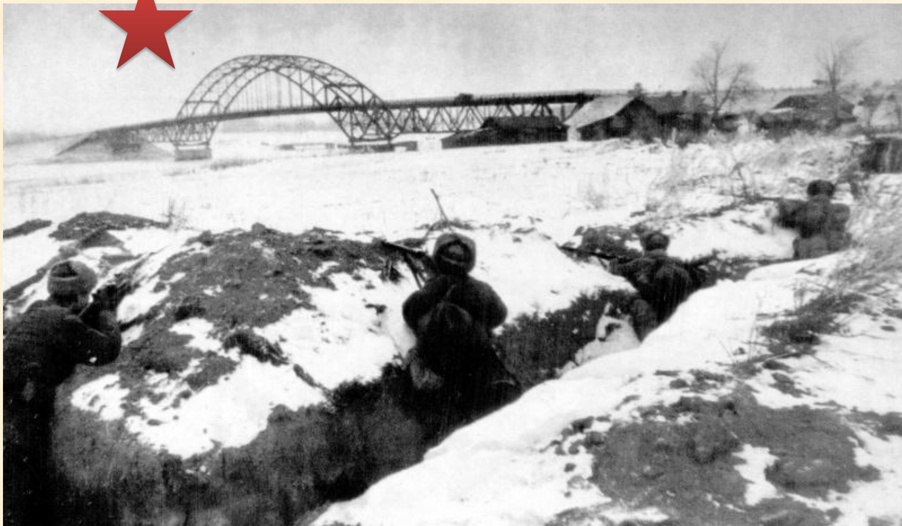
Советские солдаты в траншеях в обороне на берегу Москвы-реки