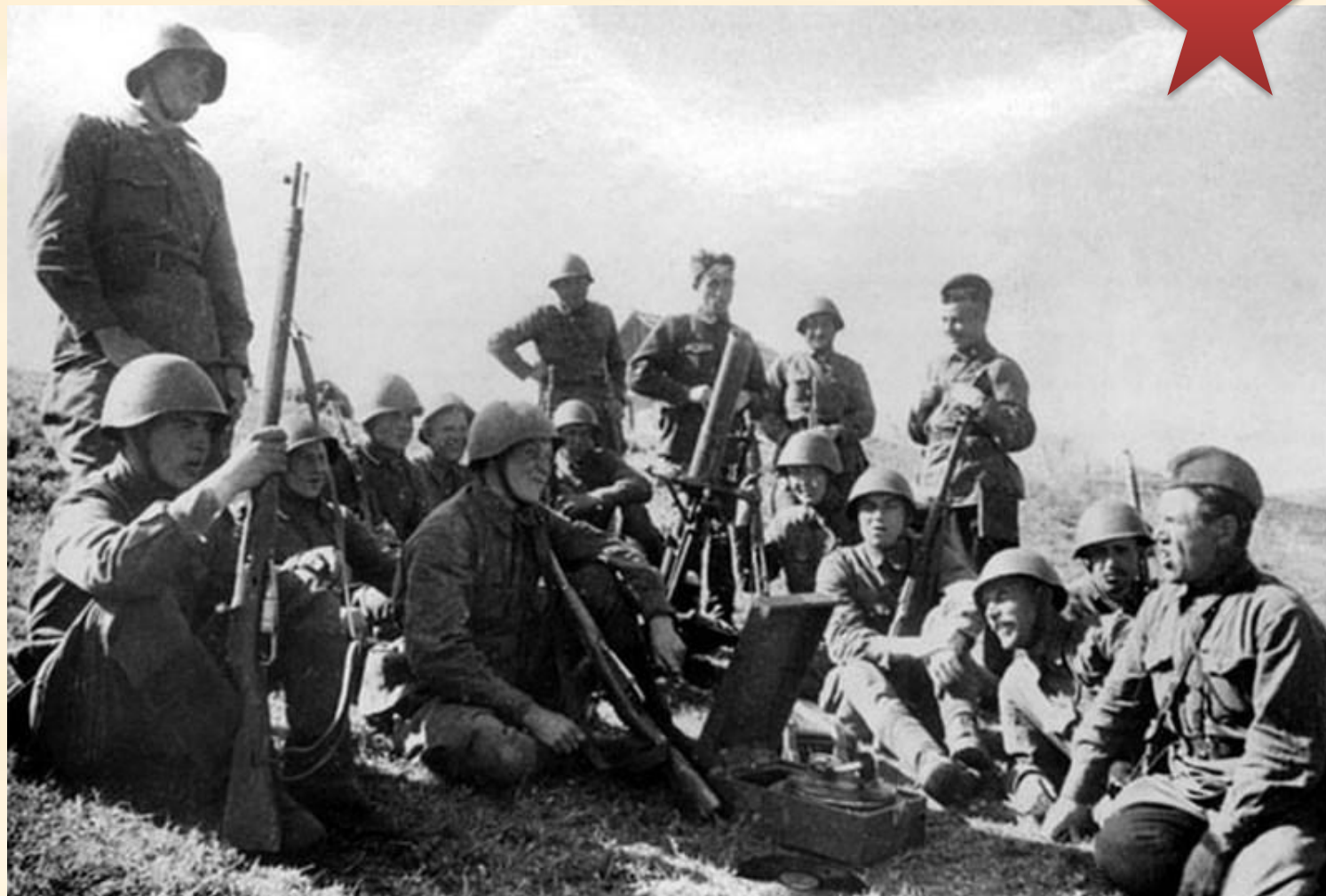
Минометчики на привале слушают патефон. 49 армия, 2-й белорусский фронт.