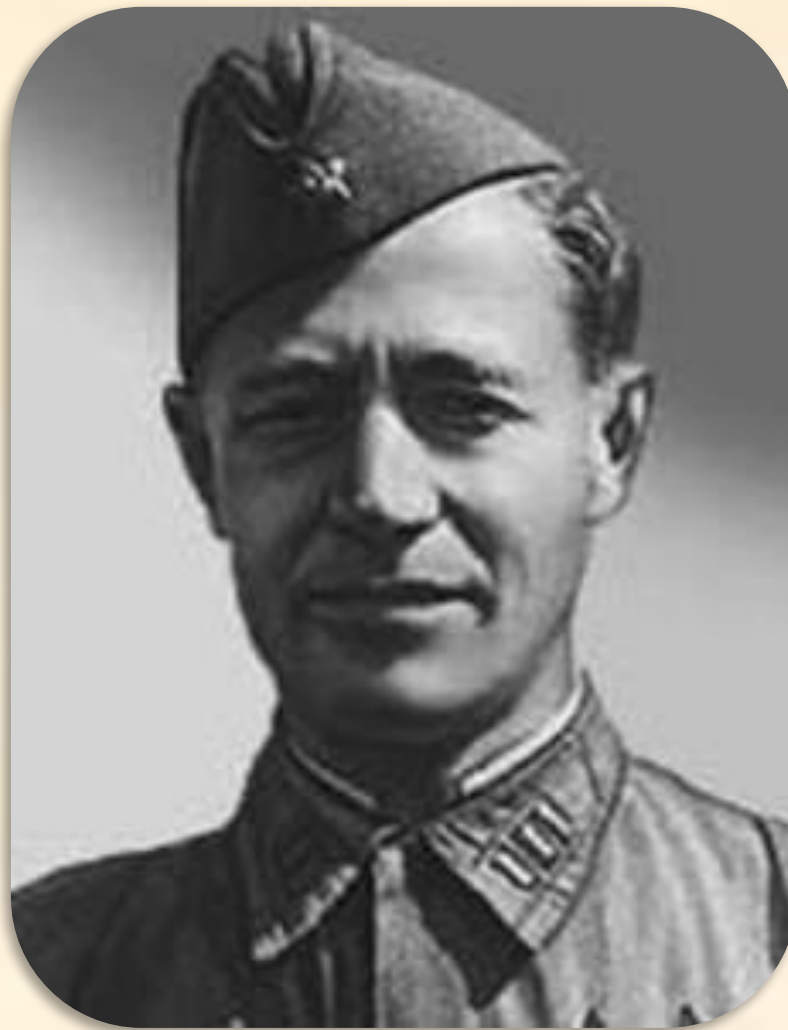
военный корреспондент фронтовой газеты «Красноармейская правда» и поэт Алексей Сурков