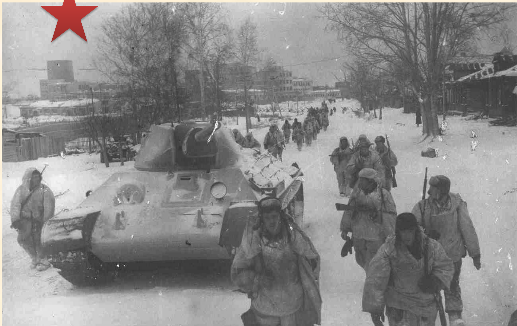
Советские войска на марше