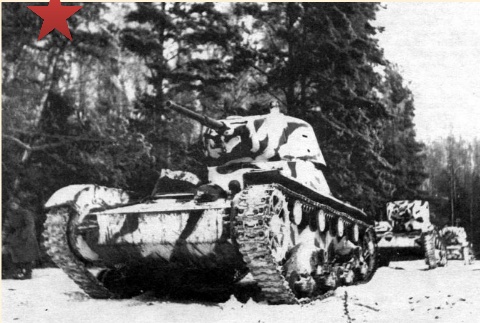
Советские легкие танки Т-26 под Москвой в декабре 1941