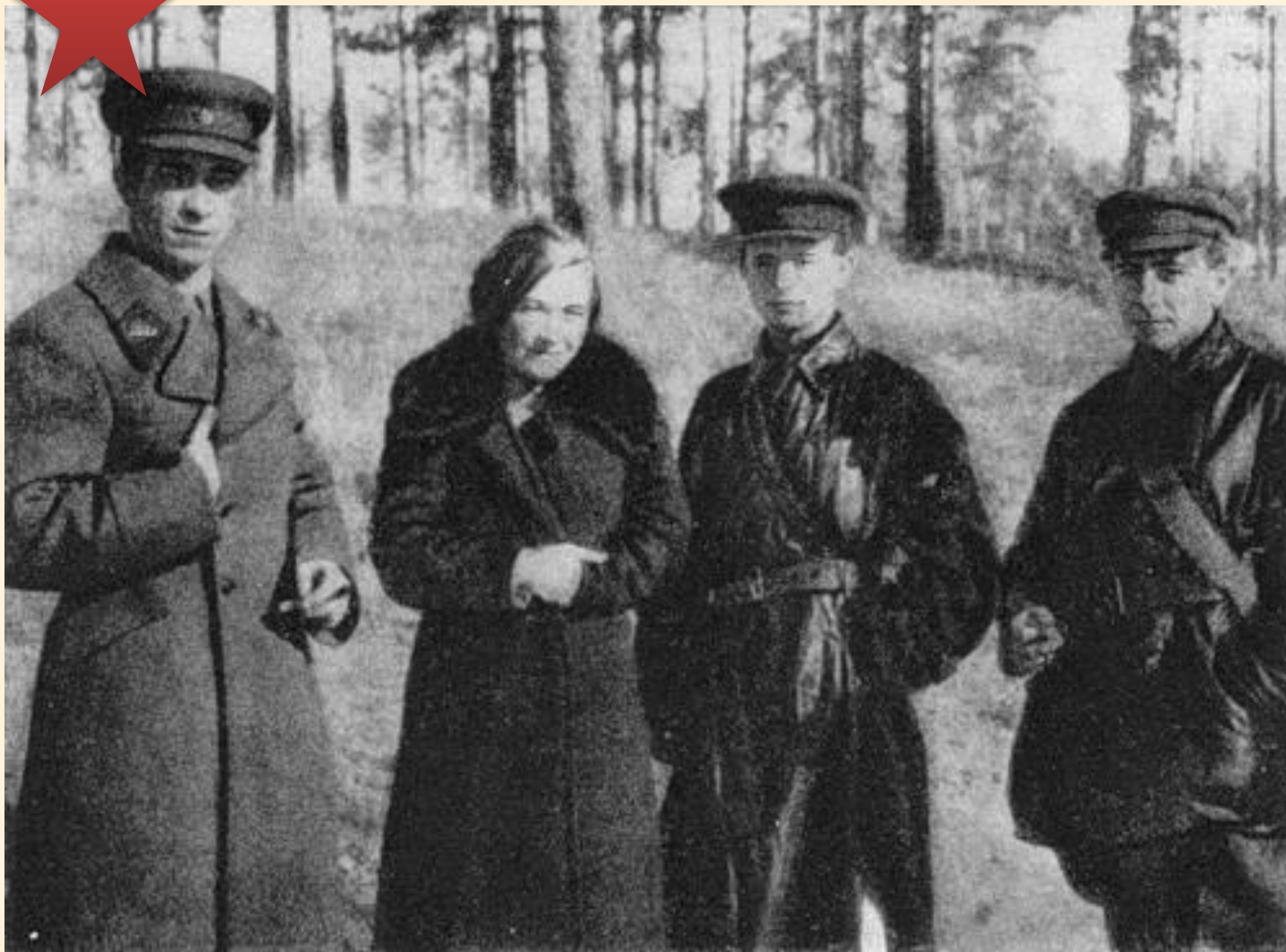
Ольга Берггольц на Ленинградском фронте сентябрь 1942 года