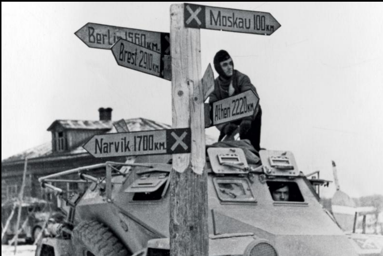
Немецкие солдаты на бронев автомобиле. На указателе надпись до Москвы 100 км.