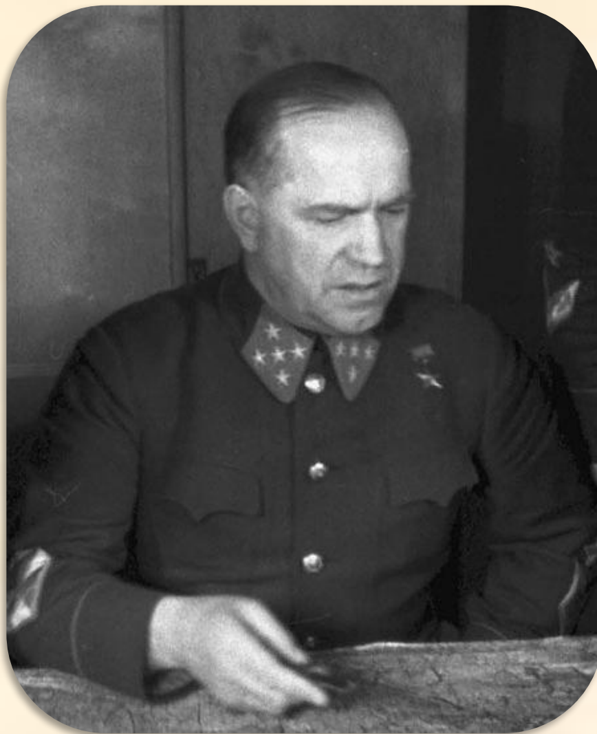
Георгий Константинович Жуков в октябре 1941