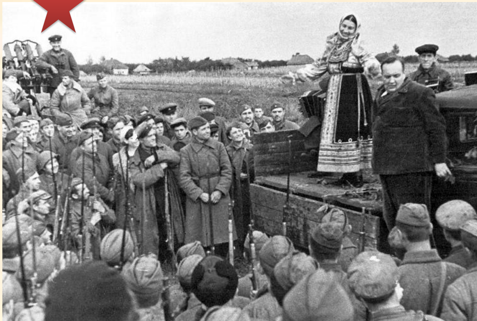
Лидия Русланова на фронтовом концерте. Южный фронт. 1941 год