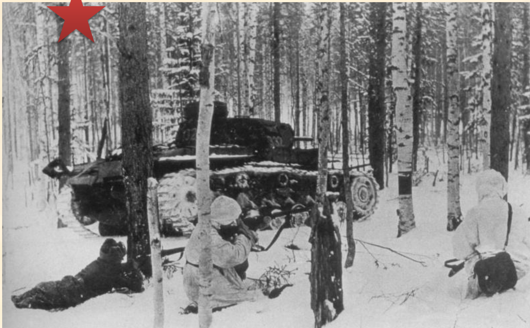
Советские солдаты в бою в лесу под Москвой