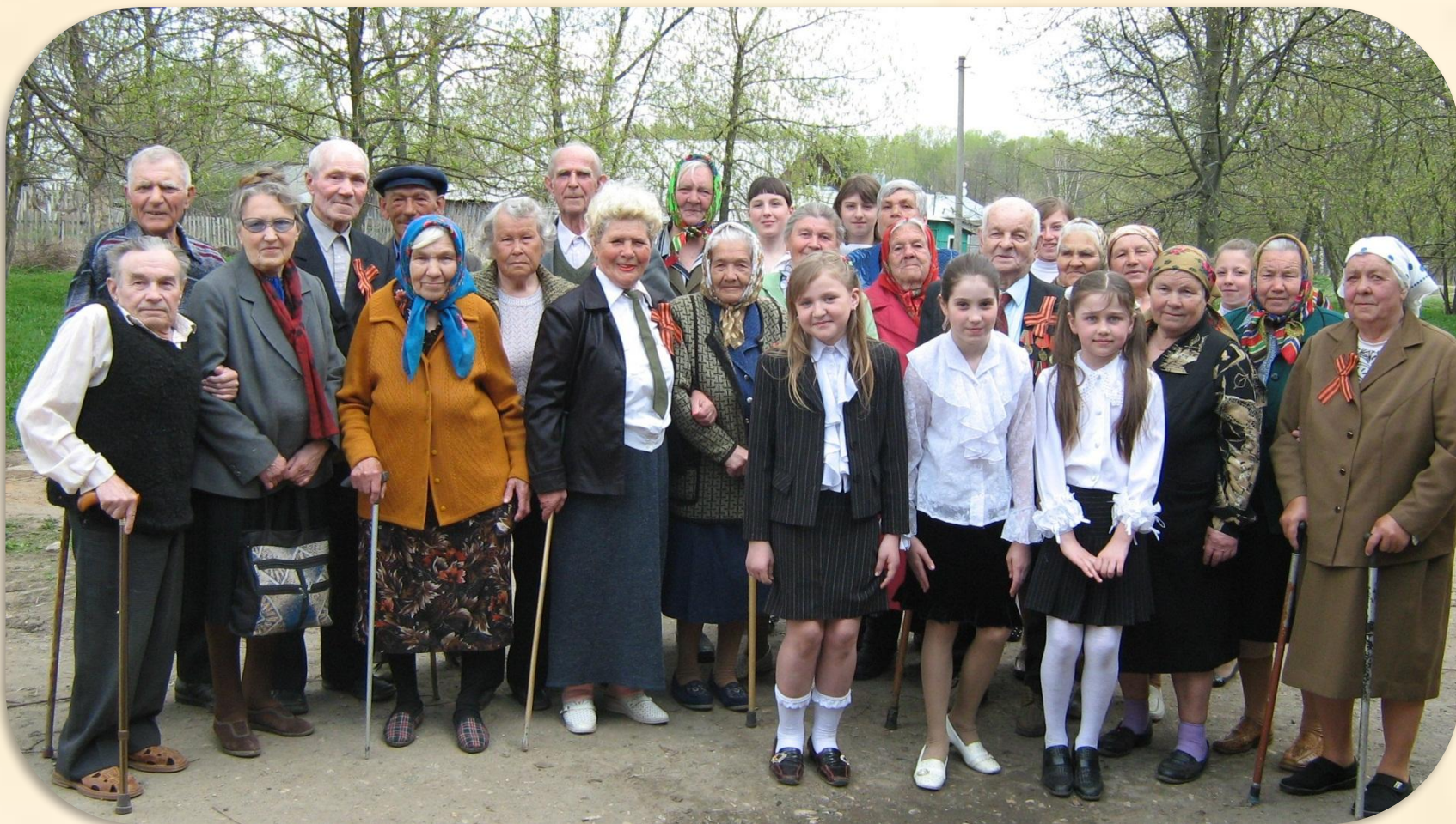
Мои односельчане. Участники и ветераны ВОВ, труженики тыла, ветераны труда.