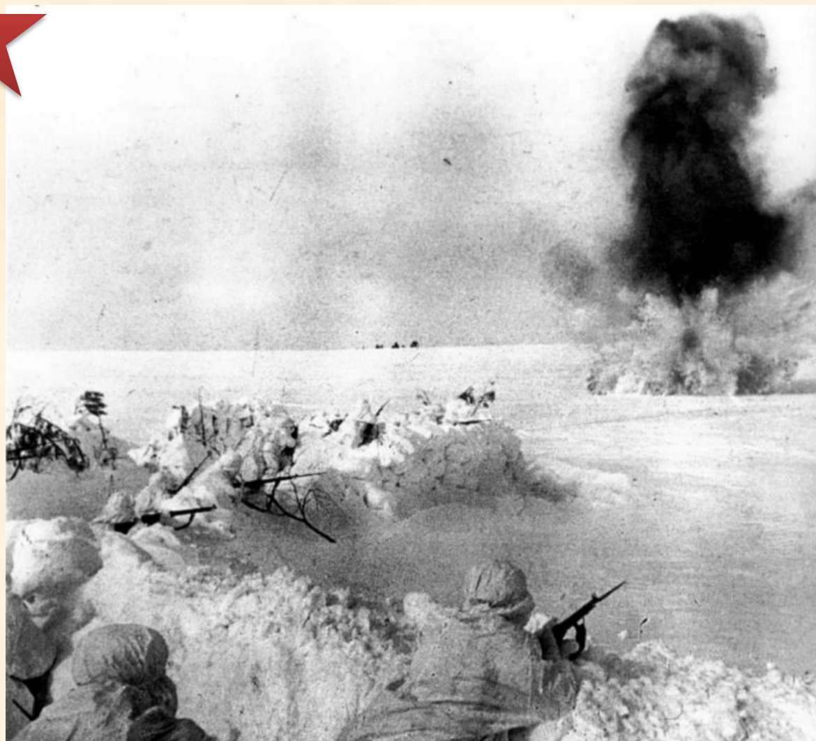
Советский оборонительный рубеж на московском направлении под артобстрелом