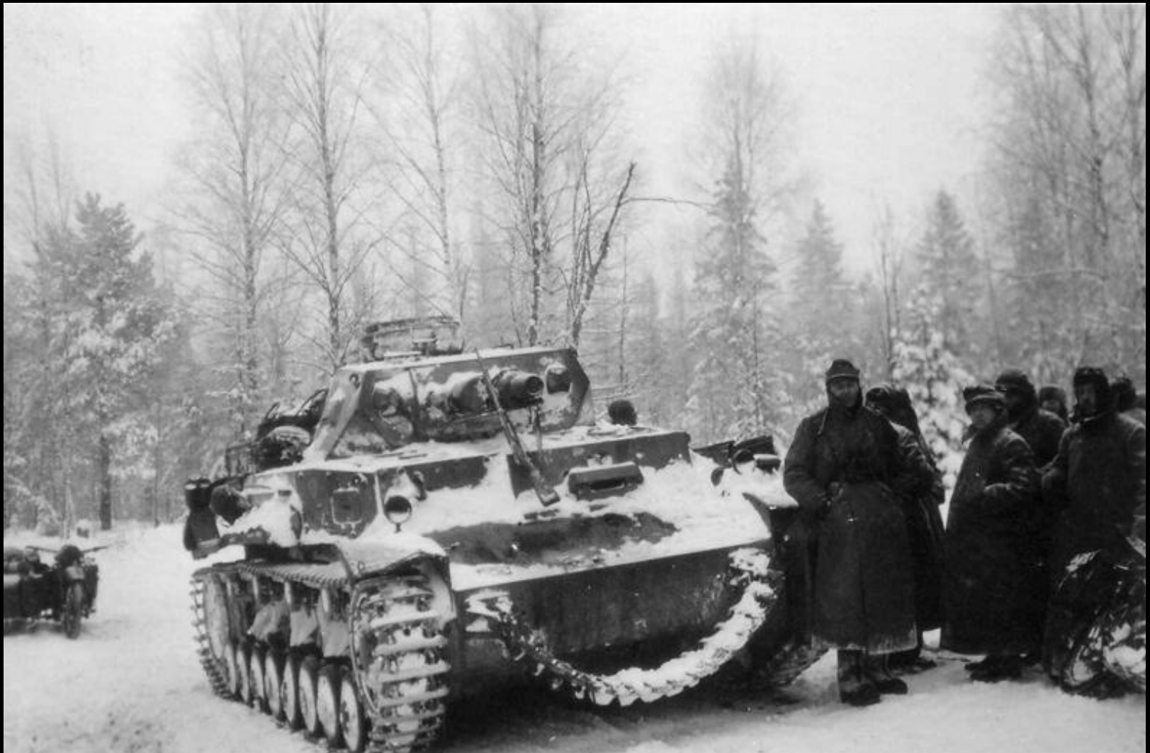
Немецкие солдаты у танка под Москвой. На стволе орудия танка висит трофейная советская винтовка Мосина.