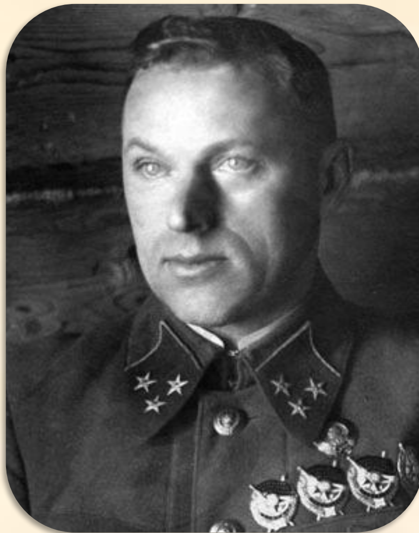
командующий 16-й армией Западного фронта генерал - лейтенант Константин Константинович Рокоссовский 1941