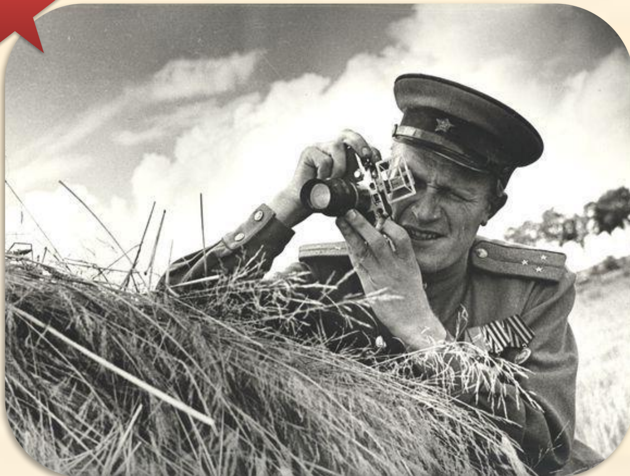
фотожурналист Михаил Савин снимал войну с первого до последнего её дня