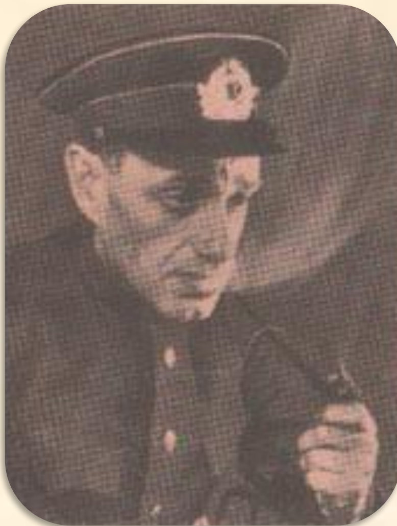
композитор Константин Яковлевич Листов (1900-1983) фото военных лет