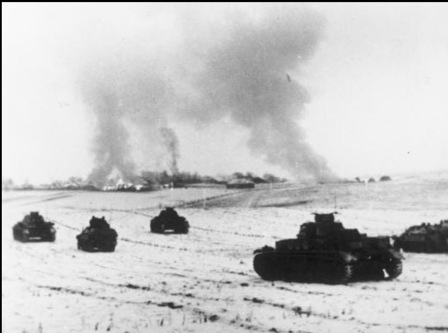
Немецкие танки атакуют советские позиции в районе Истры ноябрь 1941 года