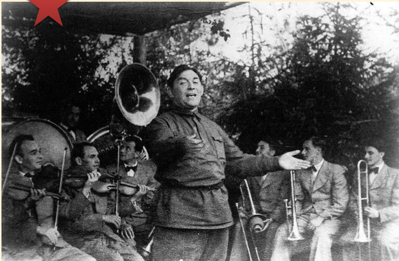
выступление на фронте Леонида Осиповича Утесова 1942 год