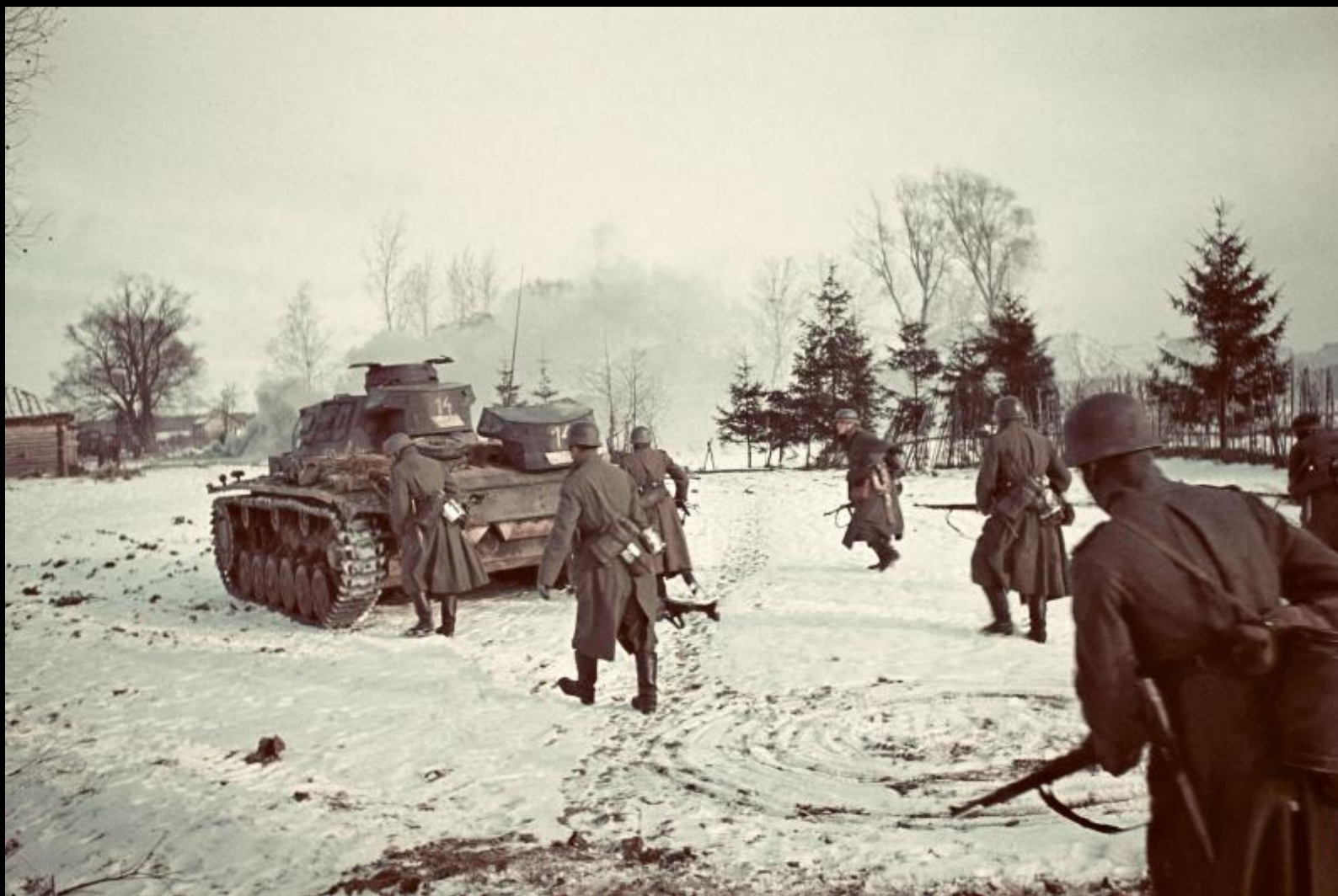
Немецкая танковая дивизия под Волоколамском, в 100 км от Москвы