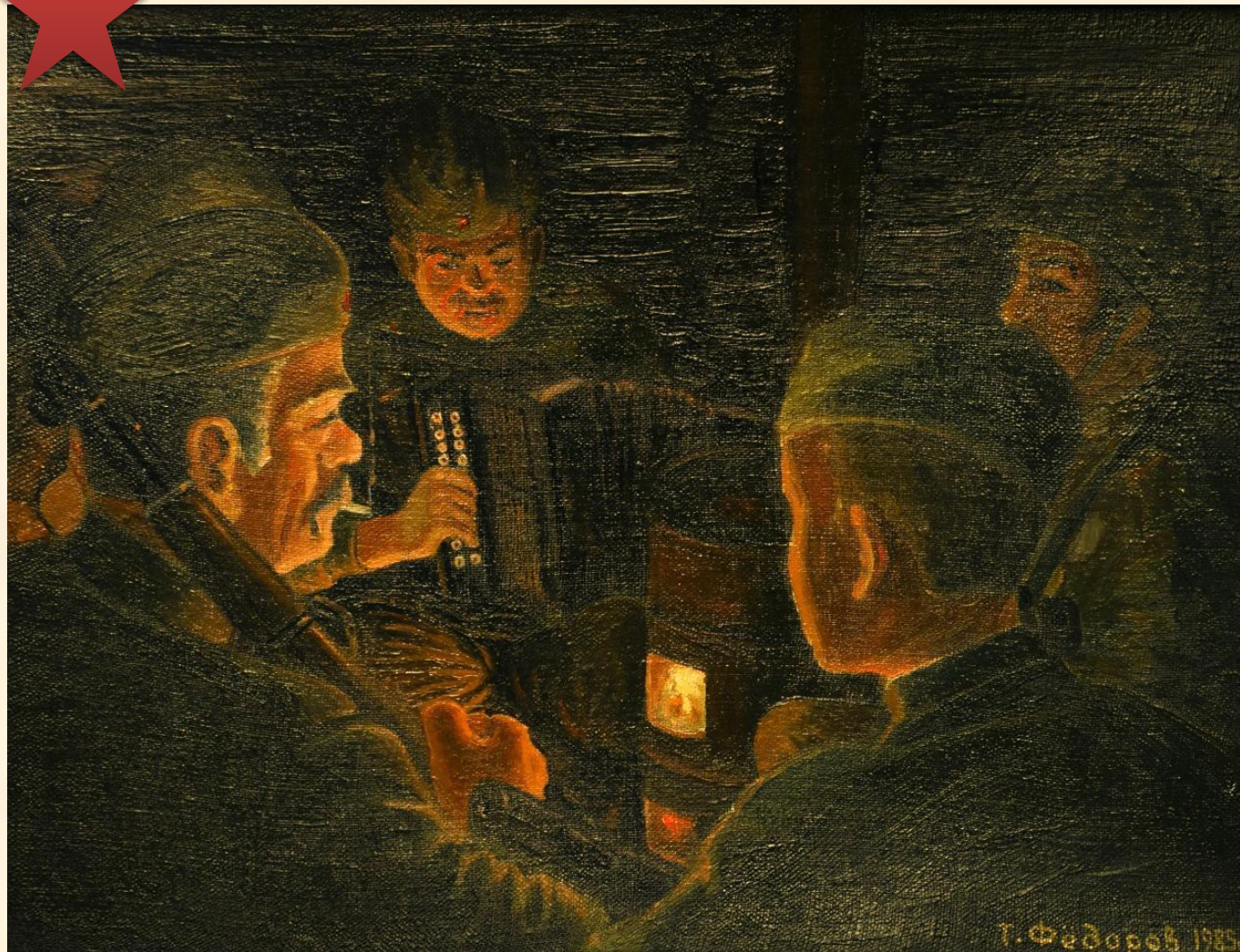
Т. Фёдоров Бьется в тесной печурке огонь 1985 г.