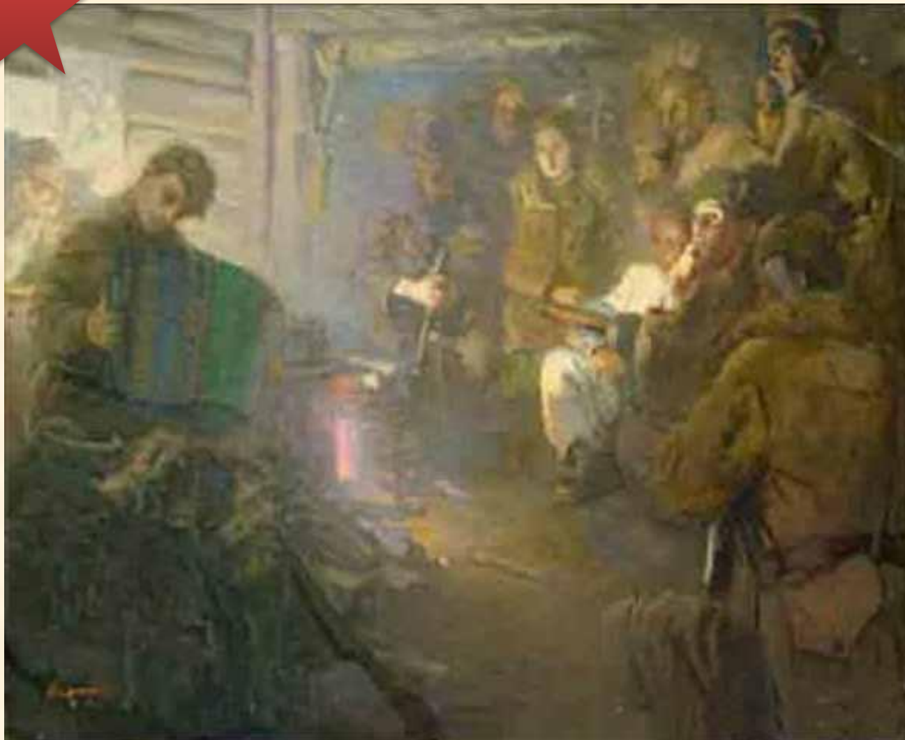
И. Евстигнеев В землянке. Гармонь. 1945 г.