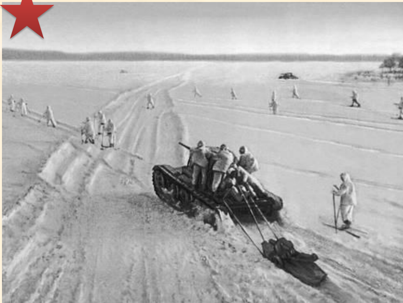
Советские солдаты-лыжники в снегах Подмоскovie 1941