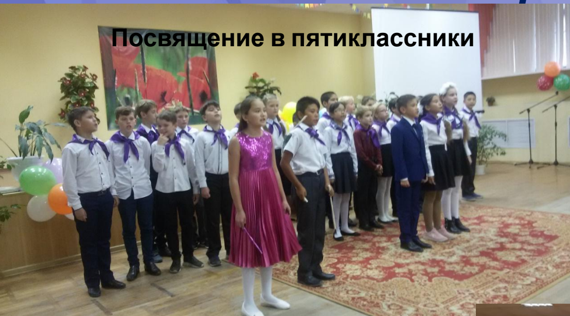
Посвящение в пятиклассники