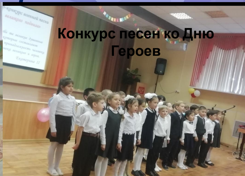
Конкурс песен Великого Подвига