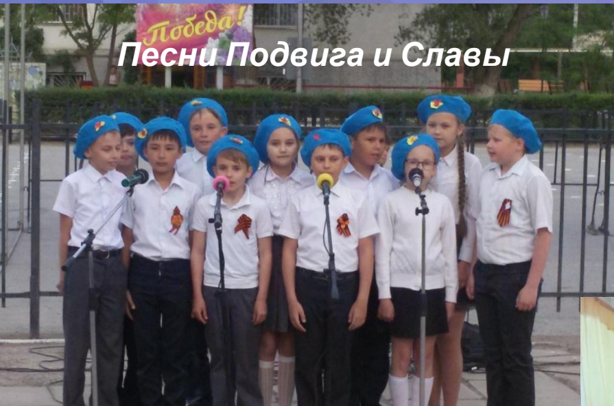
Песни Подвига и Славы