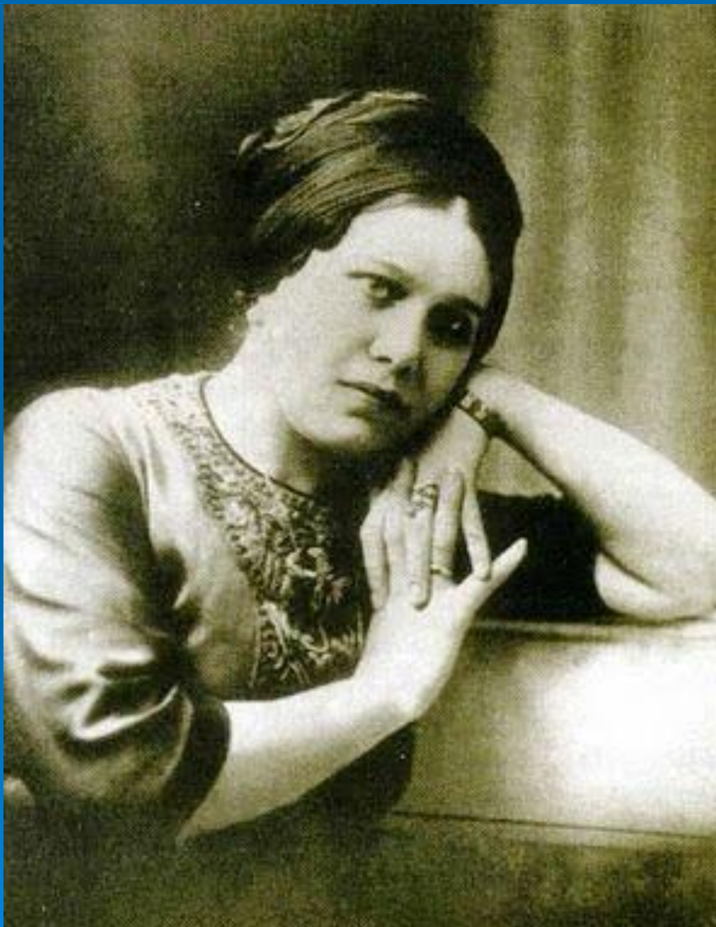
Надежда Васильевна Плевицкая (1879-1940)