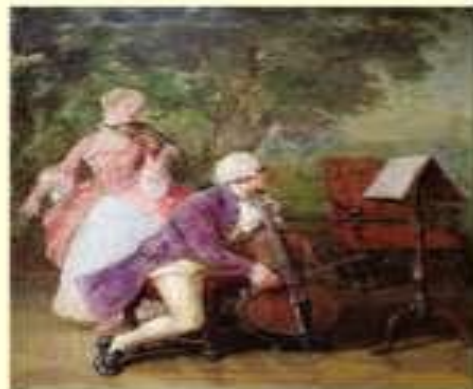
Родилась скрипка в Италии почти 500 лет назад.