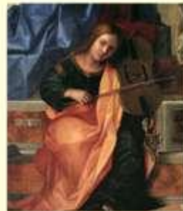
Арабский ребаб, Испанская фидель, Британская кротта,