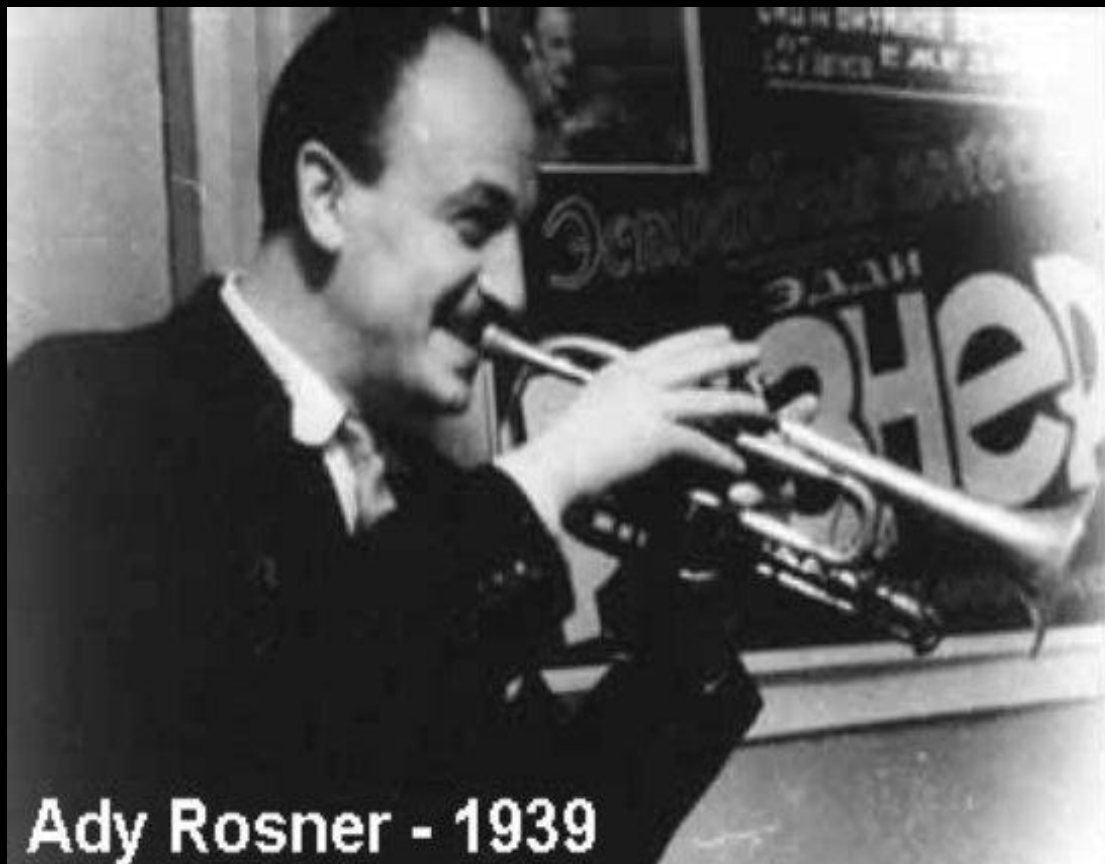
Ady Rosner - 1939