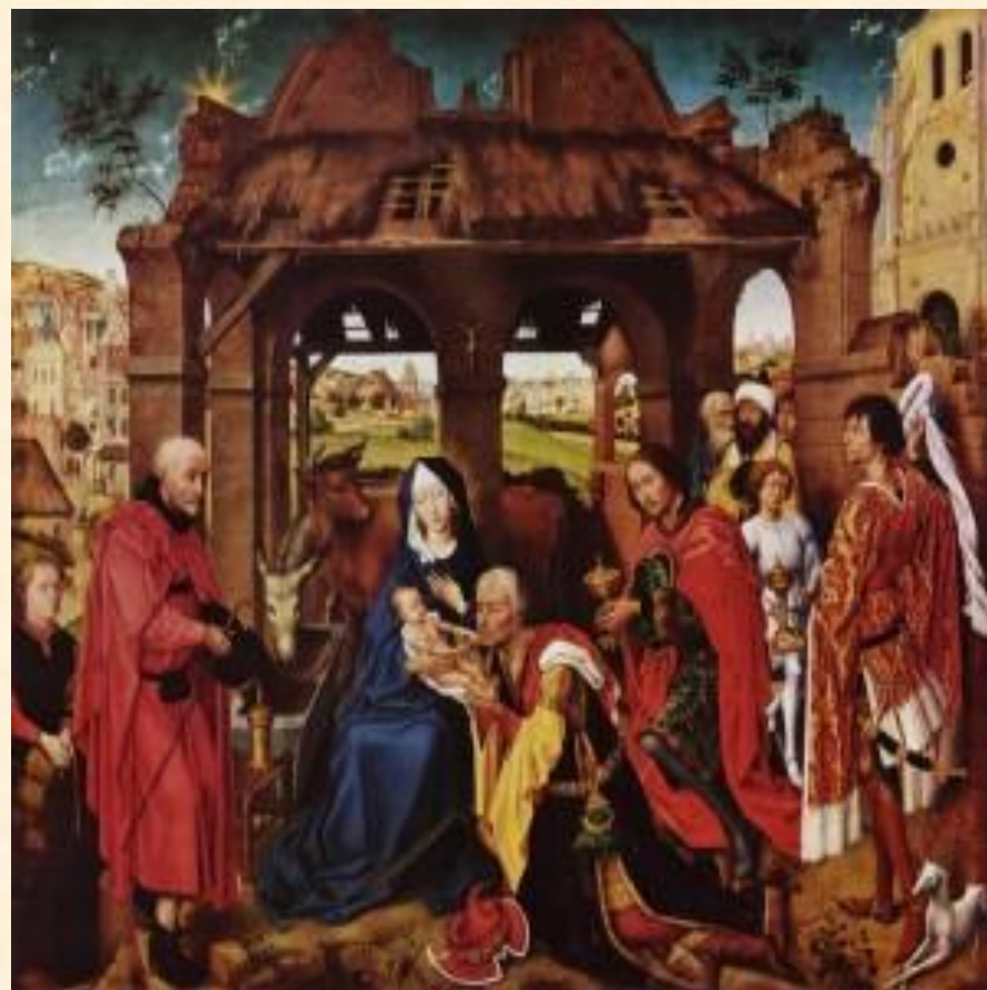
Рогир ван дер Вейден. Поклонение волхвов.

Праздник этот связан с появлением новой жизни, добра и света на Земле.