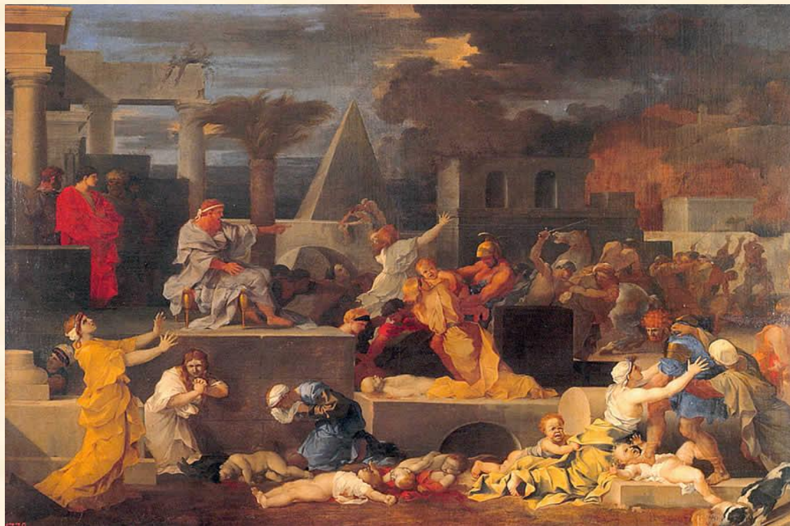
Избиение младенцев .Себастьян Бурдон. Начало 1640-х

Но скоро наказание постигло жестокого убийцу. Царь Ирод умер от неизвестной болезни в страшных мучениях.