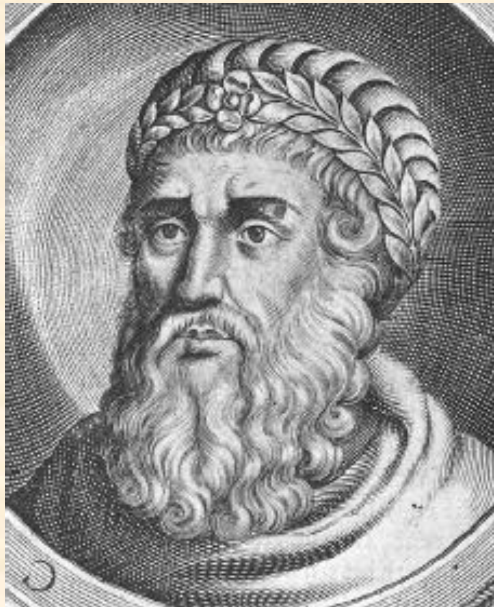
Ирод I Великий

«Найдите Младенца, а потом сообщите мне – я тоже хочу Ему поклониться» – так сказал Ирод волхвам (а на самом деле он задумал убить Иисуса).