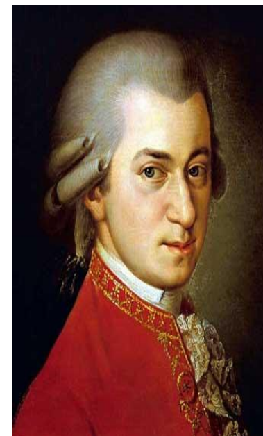
Вольфганг Амадей Моцарт