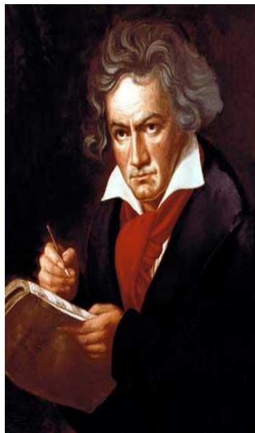
Людвиг ван Бетховен