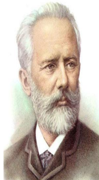
Пётр Ильич Чайковский