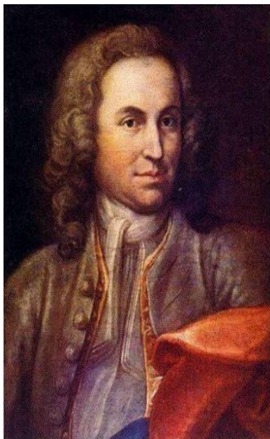
Иоганн Себастьян Бах

Когда мы слышим словосочетание « классическая музыка», то в памяти всплывают фамилии композиторов – классиков, таких как: Иоганн Себастьян Бах, Людвиг ван Бетховен, Пётр Ильич Чайковский, Вольфганг Амадей Моцарт. И это естественно, ведь XVII- XIX века считаются расцветом классической музыки.