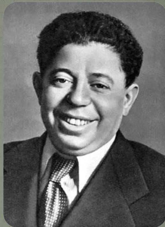
Дмитрий Яковлевич Покрасс