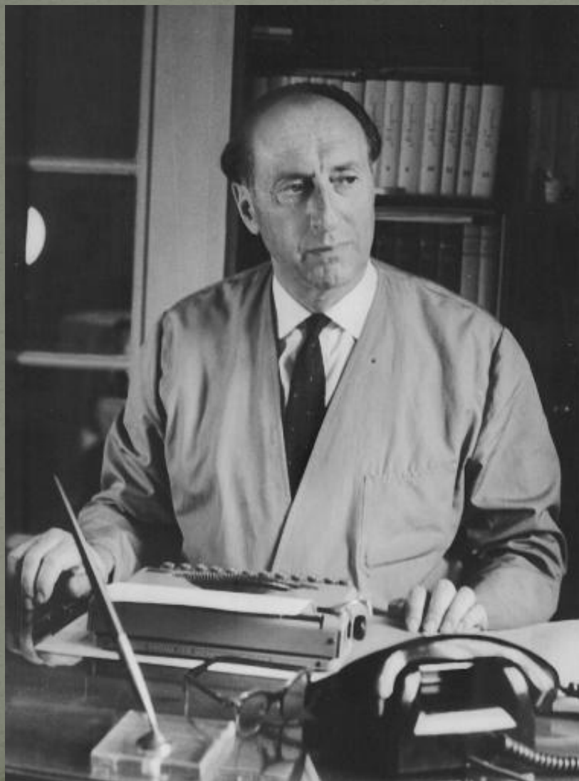
Поэт Борис Савельевич Ласкин