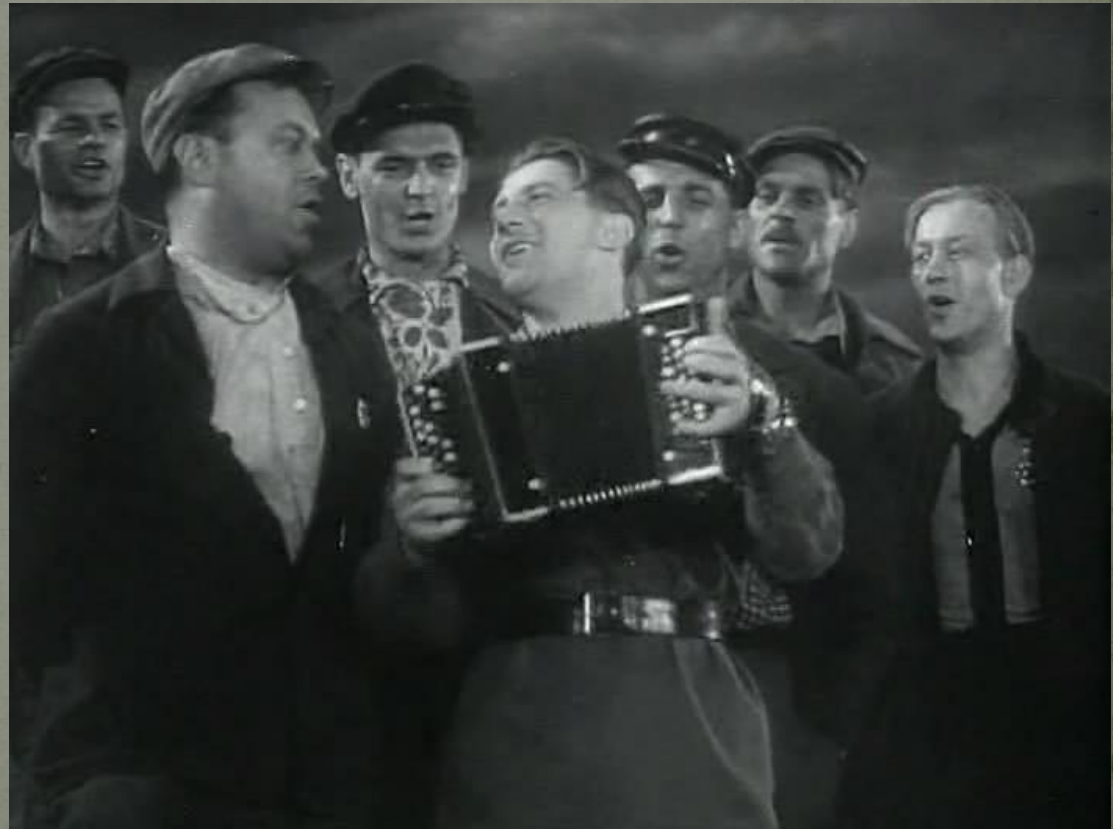
А. Твардовский поэма «Василий Тёркин»