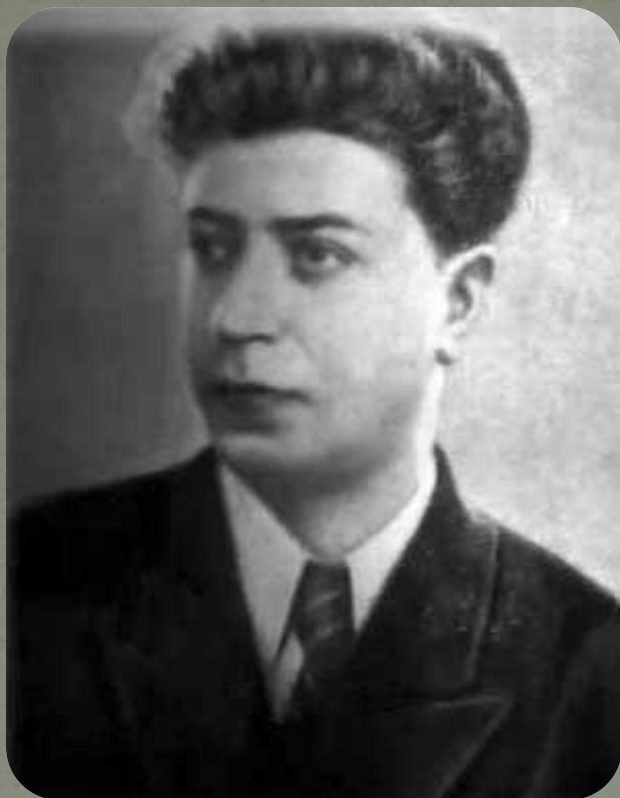
Даниил Яковлевич Покрасс