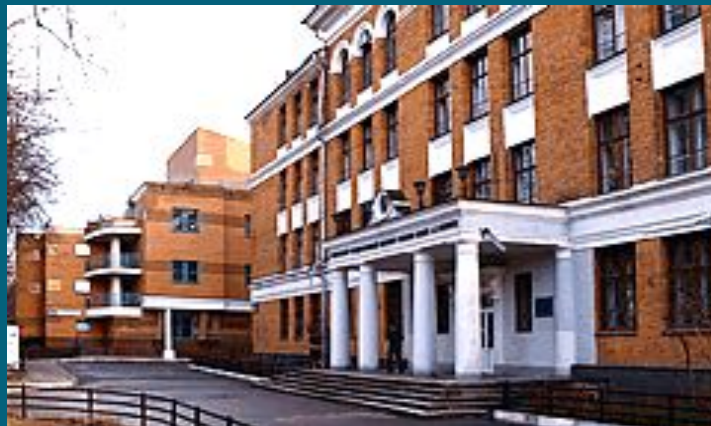
Московский музыкально педагогический институт им. А.Шнитке.