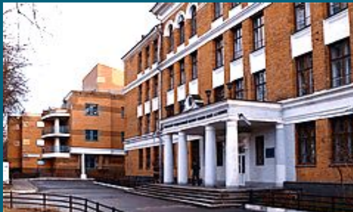
Московский музыкально педагогический институт им. А.Шнитке.