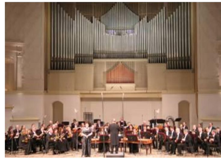
Академия музыки имени А. Шнитке