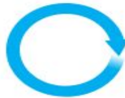
«круг»; «коло»; «колесо» — Смоленская обл. «шина» — Архангельская обл.