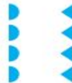
«улица» — Архангельская обл. «стенка» — Москва «проулочек» — Пермь