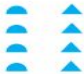
«колонна»; «шествие» — Архангельская обл.