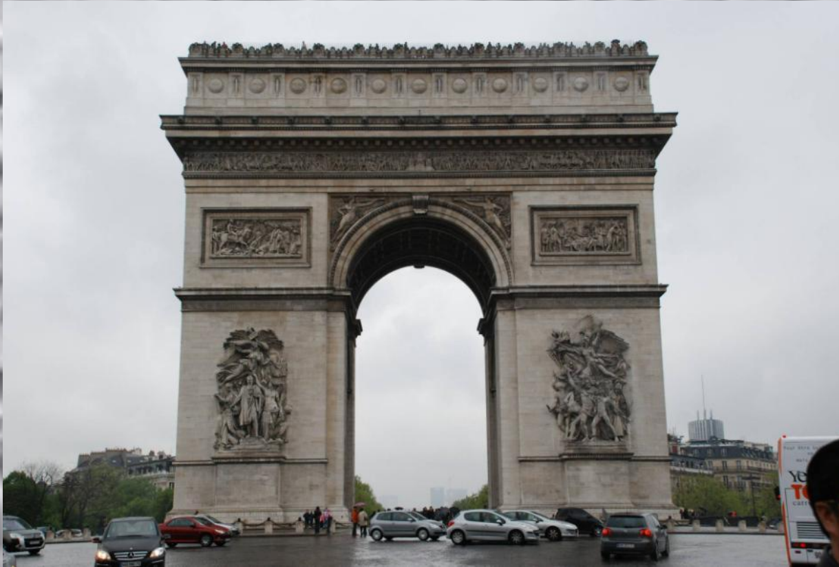
Франция, Париж, Триумфальная Арка

по указу Наполеона I, который хотел увековечить славу своей армии, построены Триумфальные ворота в Париже. На стенах арки выгравированы имена генералов, сражавшихся вместе с императором.