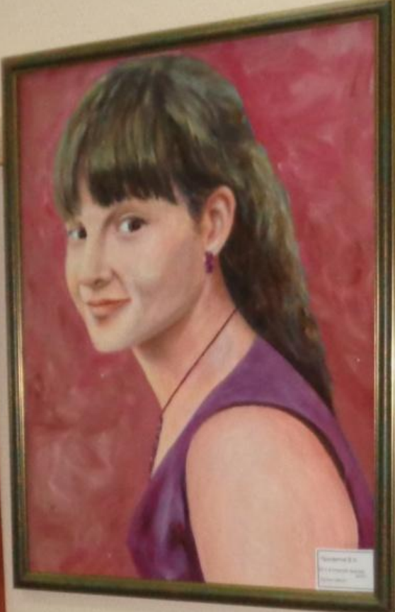
Portrait of a young woman by [unreadable] [unreadable]