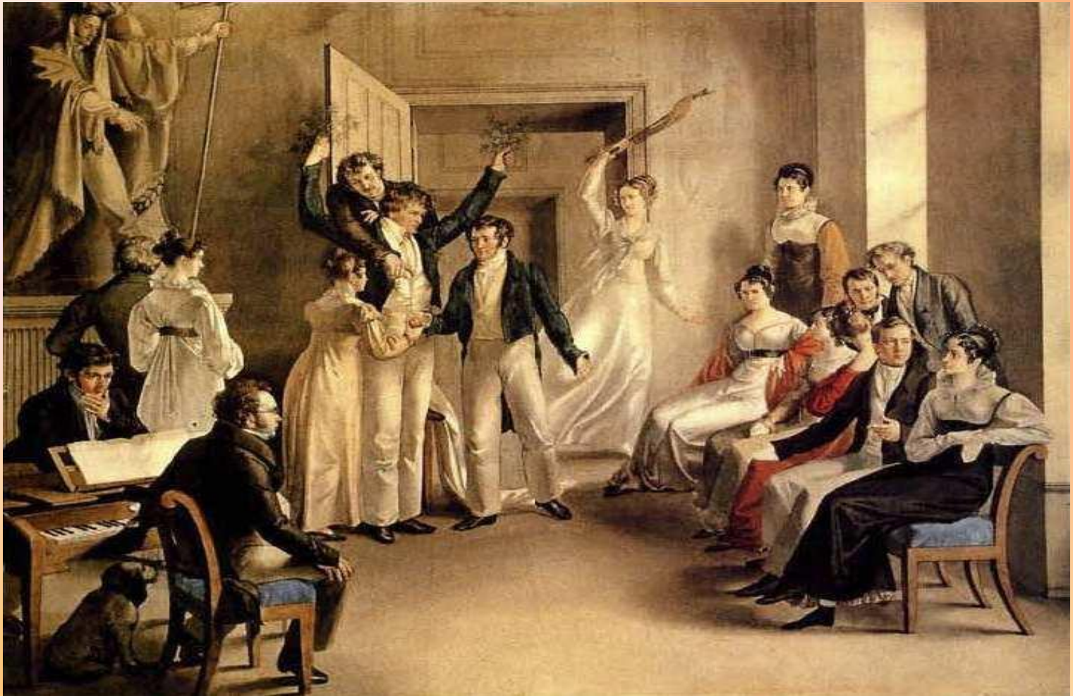
«Франц Шуберт в кругу друзей» Акварель Леопольда Купельвизера