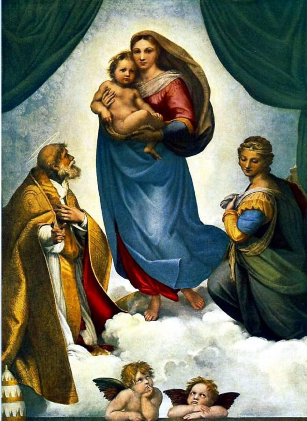
«Сикстинская Мадонна» Рафаэль