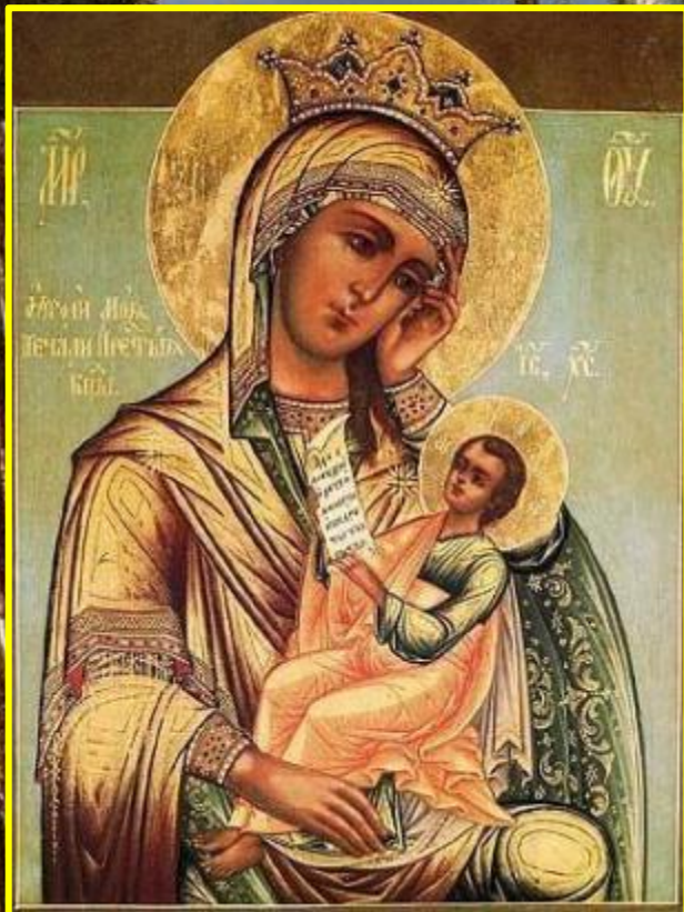
« Утоли моя печали »