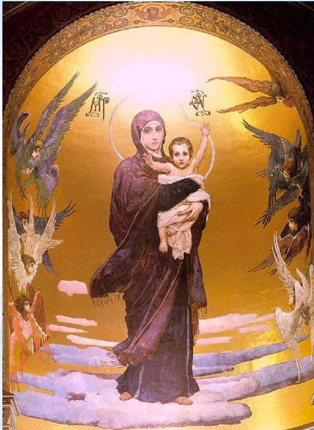
«Богоматерь с младенцем» В.Васнецов