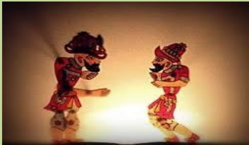
Қарагез-түрік Петрушка орыс