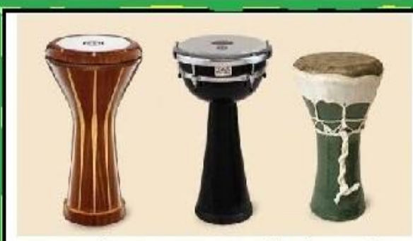
думбек - древний барабан