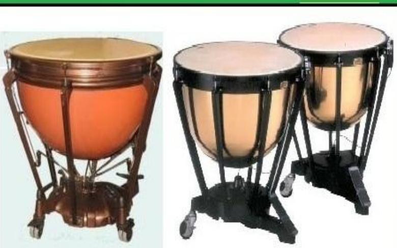
литавры (их всегда 3)