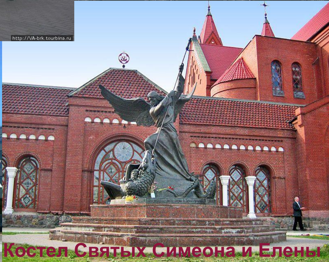
Костел Святых Симеона и Елены