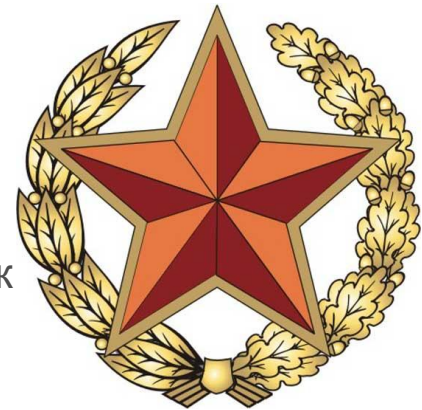
Эмблема вооружённых сил Республики Беларусь