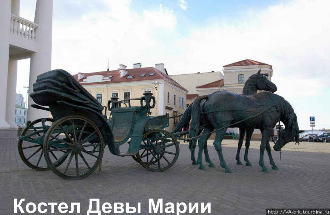
Костел Девы Марии