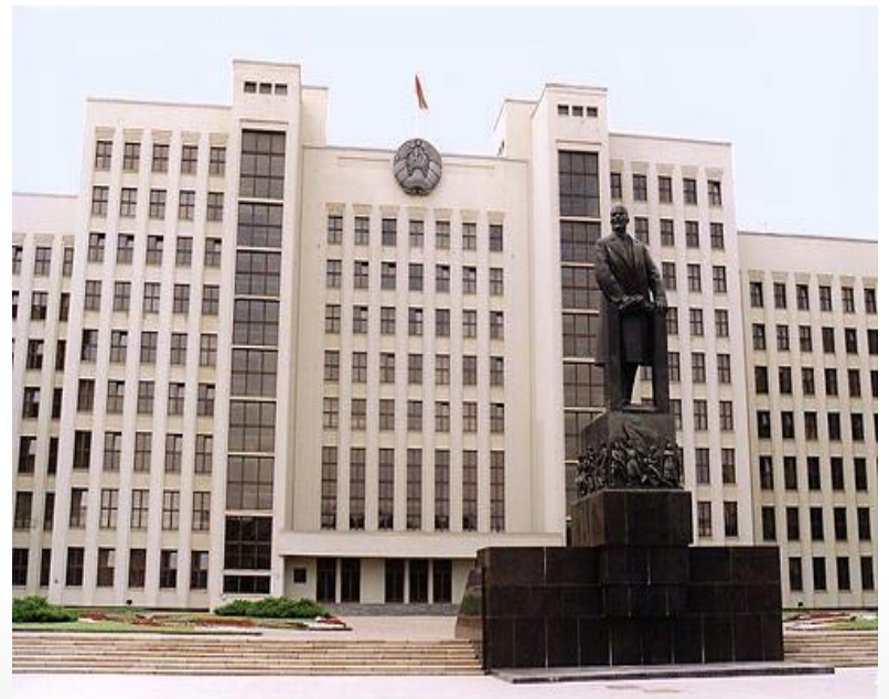
Минск. Дом Правительства