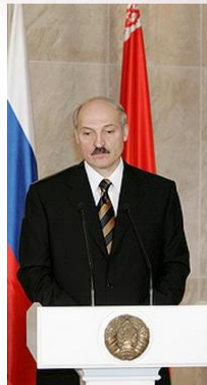
Лукашенко А. Г.