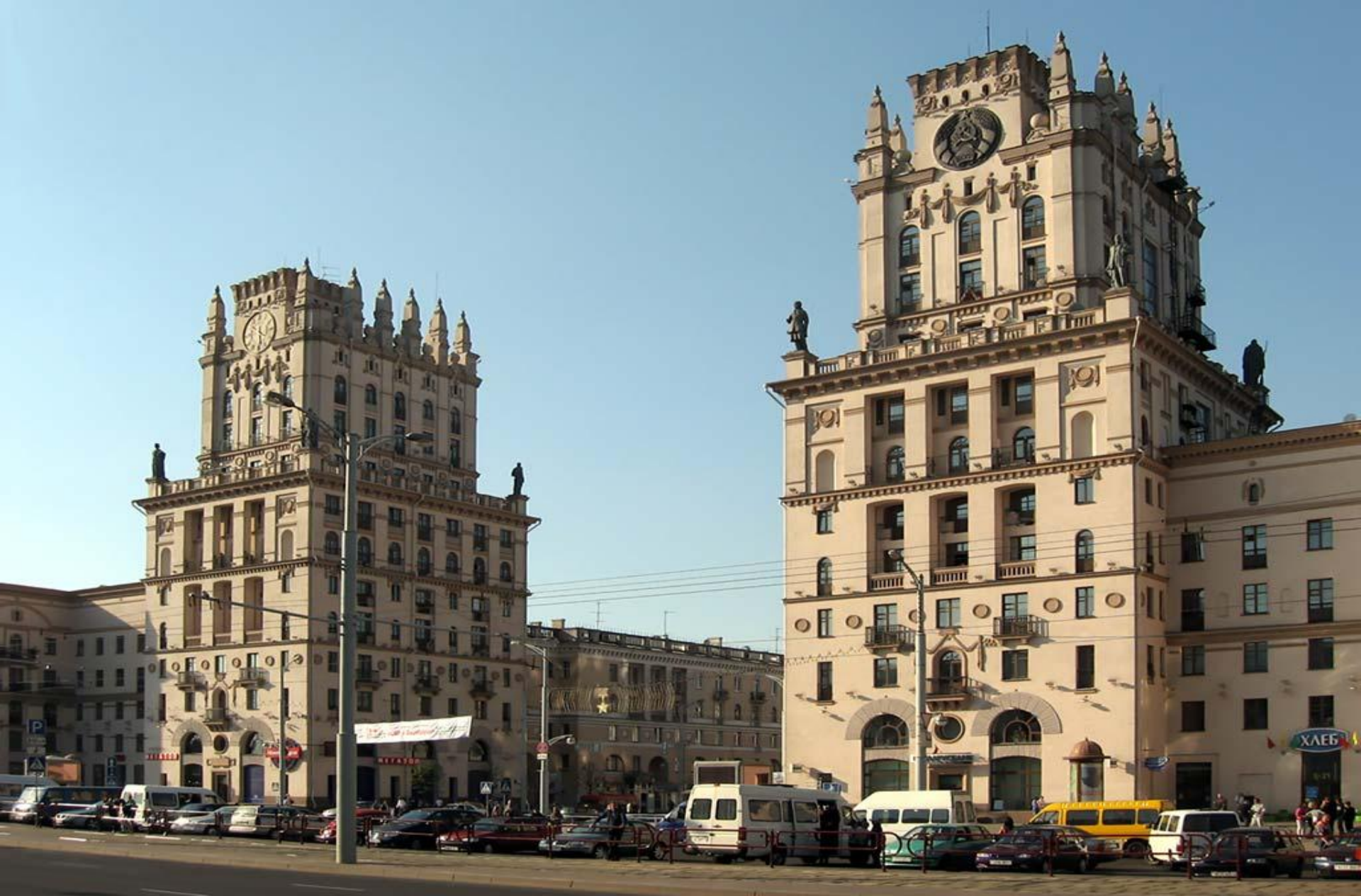
Ворота на привокзальной площади