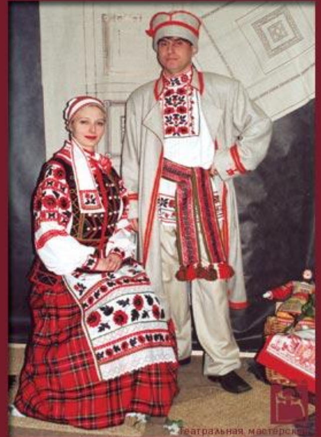
Театральная мастерская "Белорусский" г. Мирный (художник Н.Студенова)