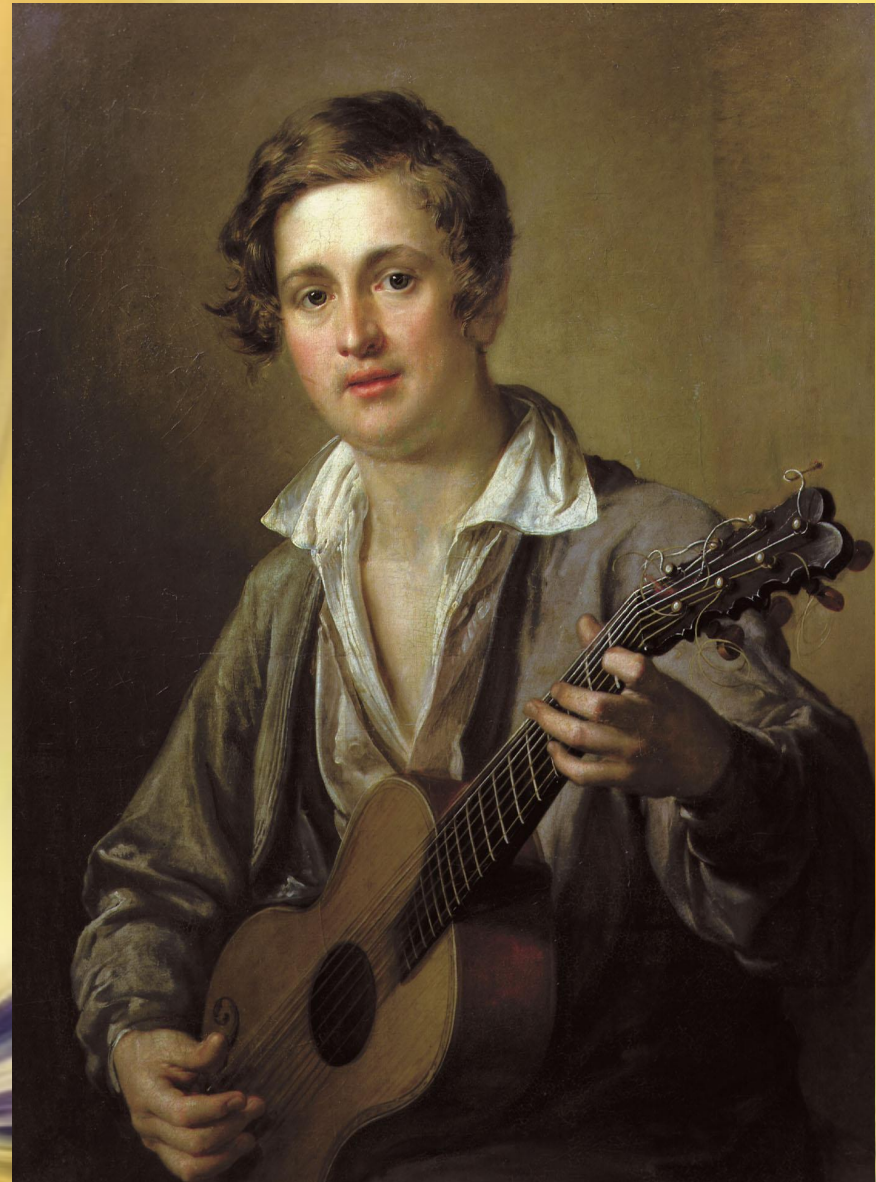
В. Тропинин. ГИТАРИСТ

Музыкой какого характера можно озвучить картину русского художника В. Тропинина «Гитарист»?