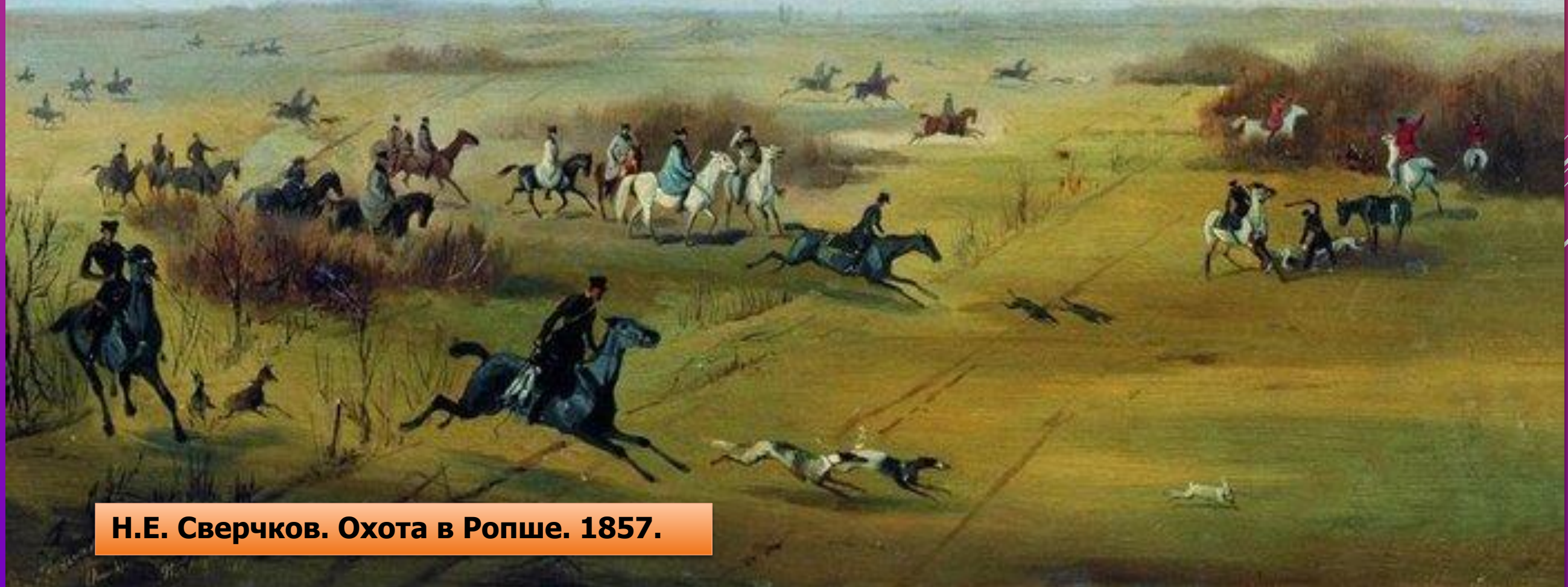
Н.Е. Сверчков. Охота в Ропше. 1857.

Трубит по утрам охотничий рог, чувствуется общее волнение.