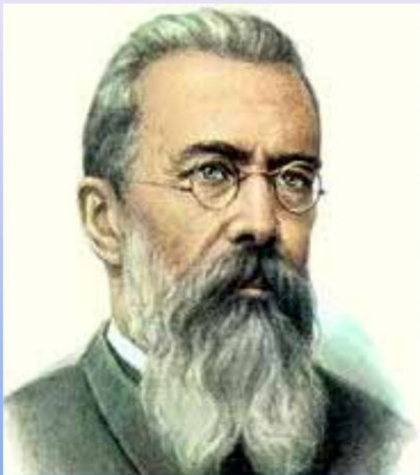
НИКОЛАЙ АНДРЕЕВИЧ РИМСКИЙ-КОРСАКОВ 1844 – 1908