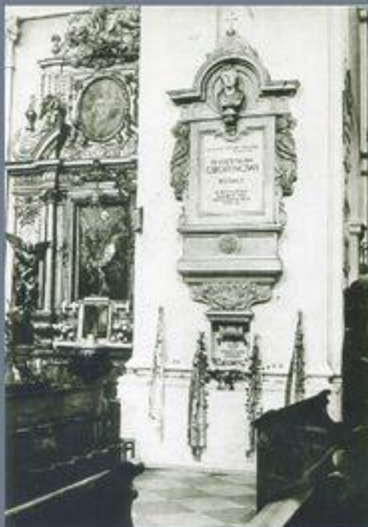
Каменная плита на месте погребения сердца Шопена. 1879, Костел Св. Креста