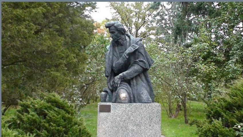
Ю. Гославский. Памятник Ф. Шопену в Желязовой Воле. 1969