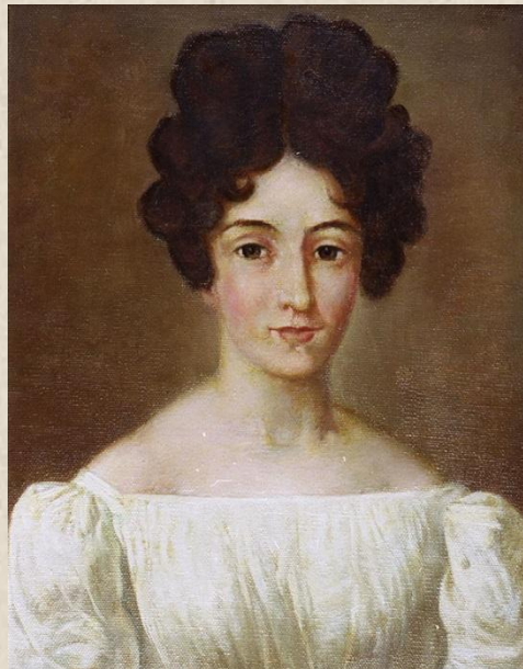
Людвика Марианна Шопен