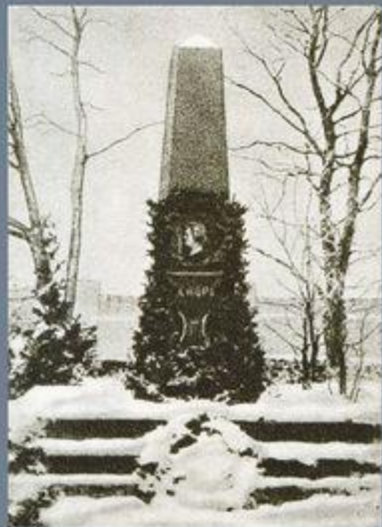
Памятник Ф. Шопену в Желязовой Воле. 1894.