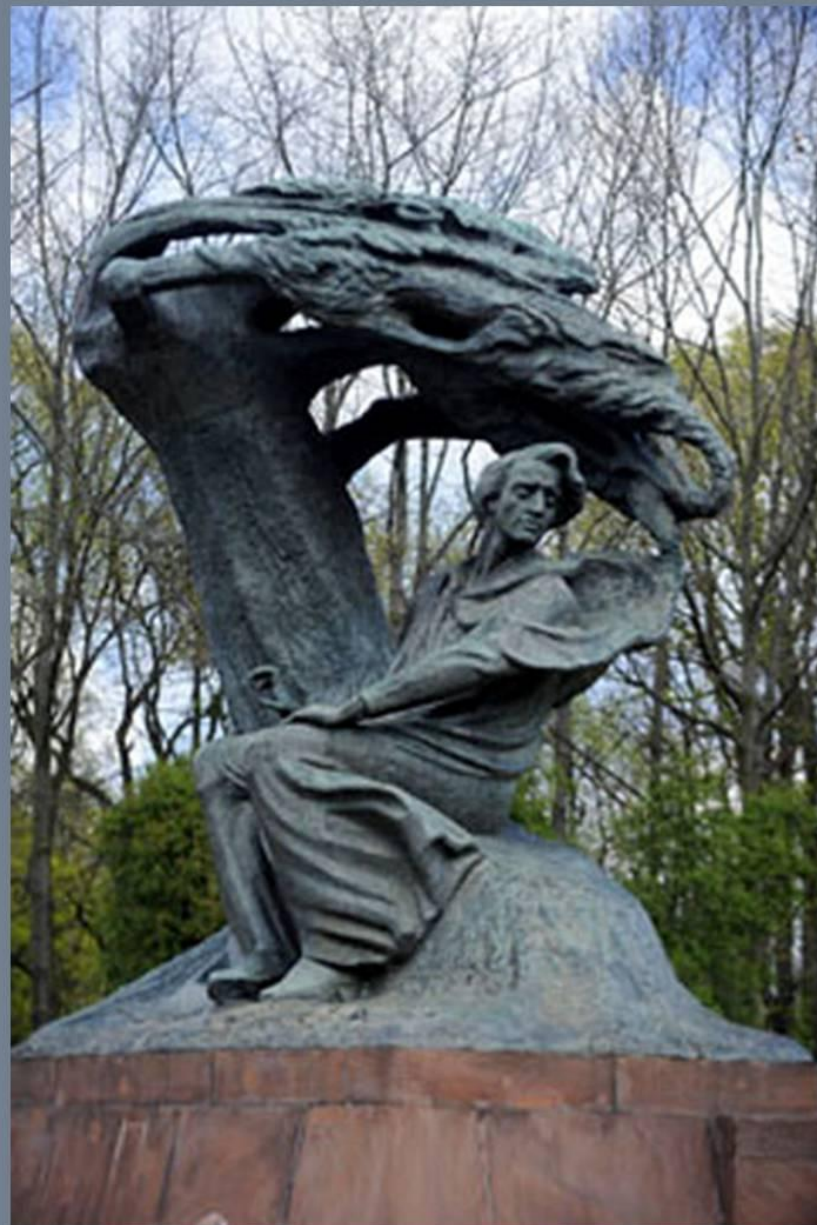
В. Шимановский. Памятник Ф. Шопену в парке Лазенки. 1908-1926. Варшава