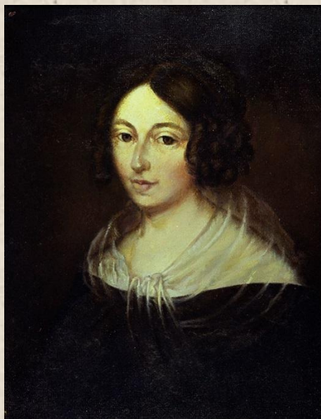
Юстина Изабелла Шопен