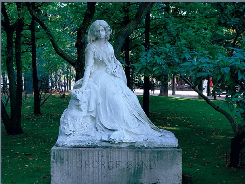
Ф.Л. Сикар. Памятник Жорж Санд. 1904. Люксембургский сад, Париж