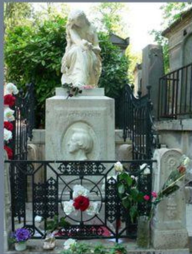
Надгробие Шопена на кладбище Пер-Лашез в Париже