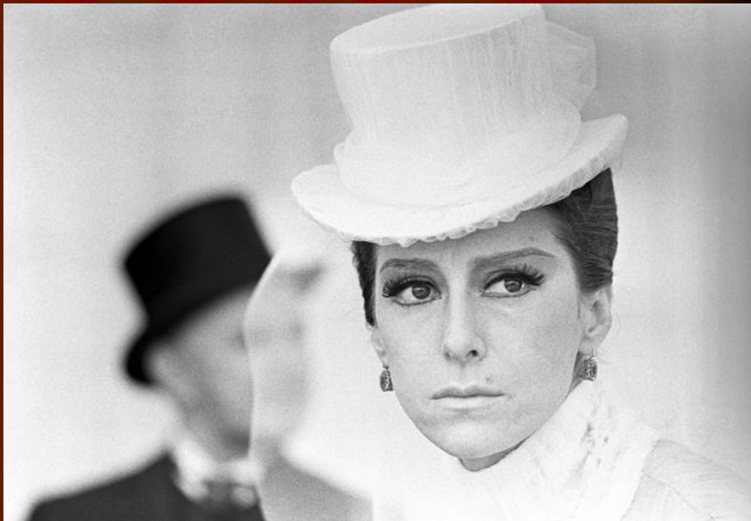
М.М.Плисецкая на съемках фильма «Анна Каренина»