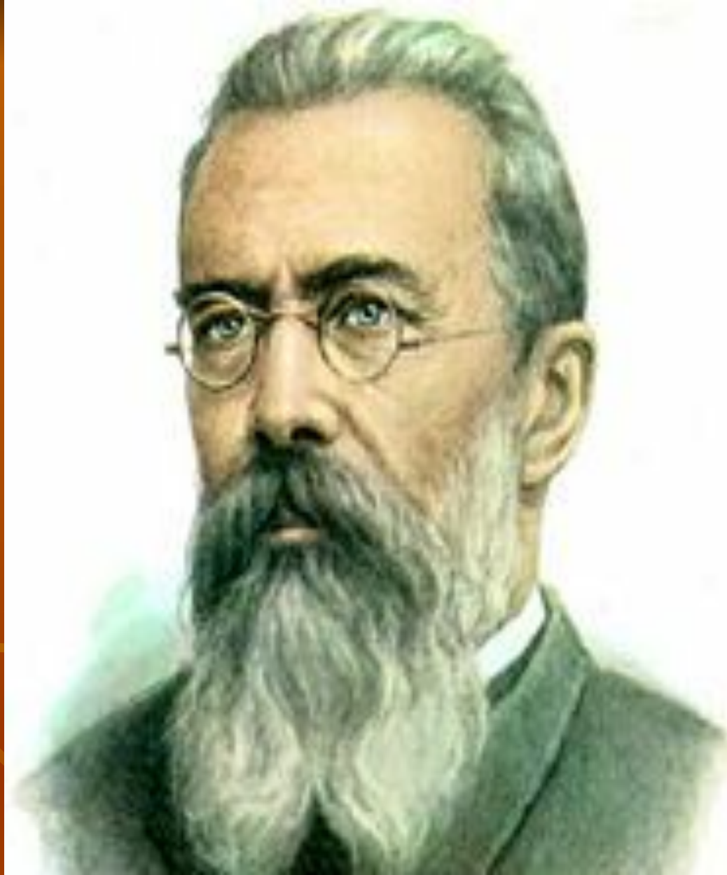
Н.А.Римский - Корсаков