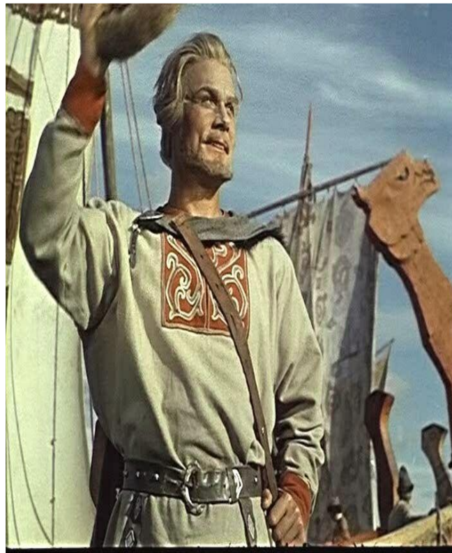
САДКО ИЗ ОПЕРЫ «САДКО» Н. А. РИМСКОГО- КОРСАКОВА