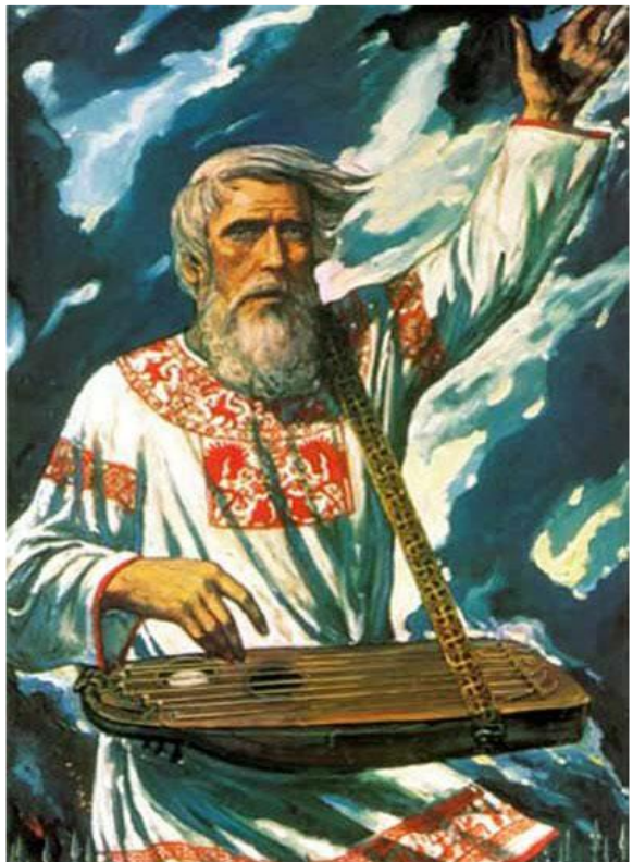
БАЯН ИЗ ОПЕРЫ «РУСЛАН И ЛЮДМИЛА» М.И. ГЛИНКА