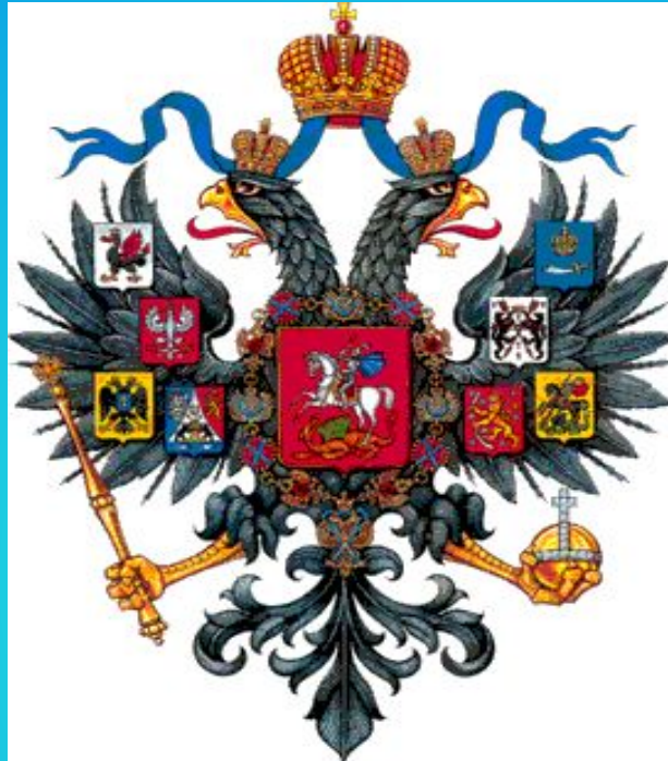
Рисунок Малого герба России, исполненный Александром Фадеевым, был высочайше утвержден 8 декабря 1856 года. Этот вариант герба отличался от предшествующих не только изображением орла, но и количеством "титульных" гербов на крыльях.