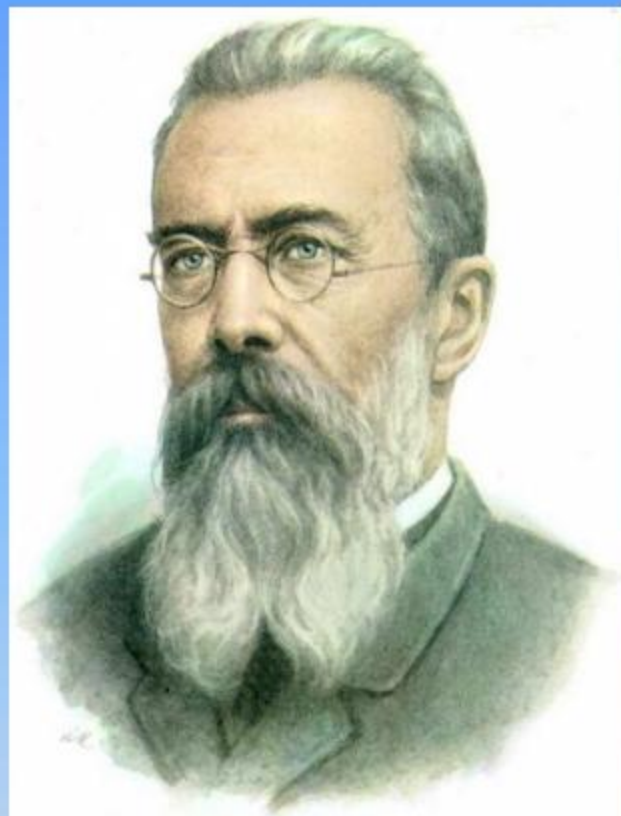
Николай Андреевич Римский-Корсаков (1844-1908)