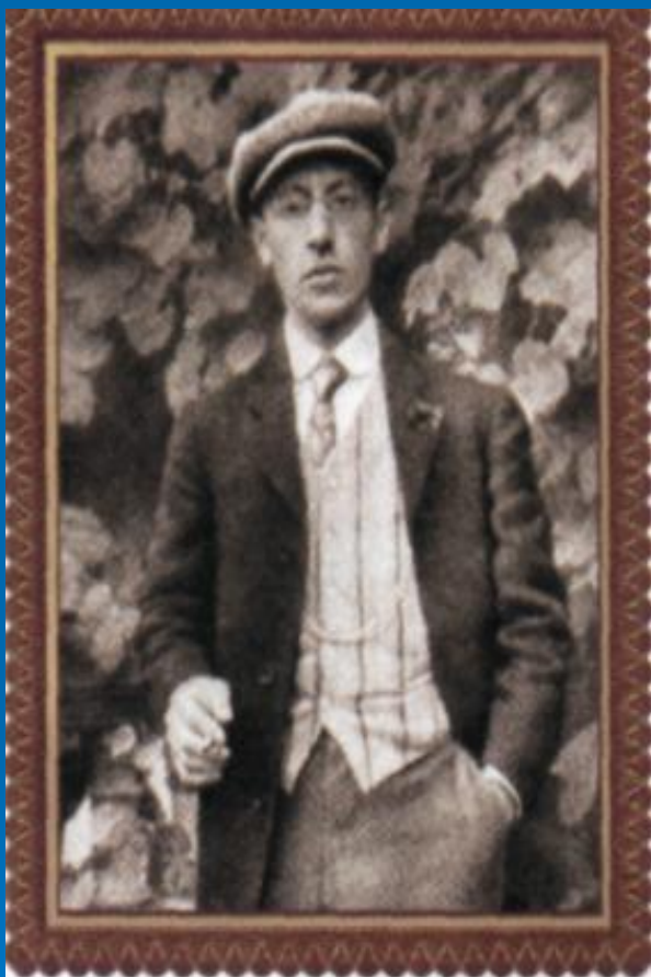
И. Ф. Стравинский (1882-1971)

- русский композитор. Он родился в Петербурге, в семье известного певца. Музыкальная обстановка в семье, встречи с выдающимися музыкантами, знакомство с богатой библиотекой отца, посещение оперного театра - всё это способствовало раннему увлечению мальчика музыкой. К 10 годам он хорошо играл на рояле и начал сочинять музыку. Занятия в юношеские годы с Н. А. Римским-Корсаковым завершили музыкальное образование И. Стравинского.